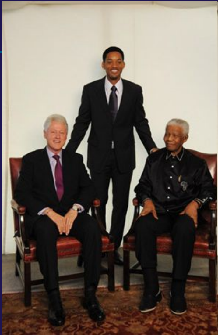
С Биллом Клинтонем и Уиллом Смитом