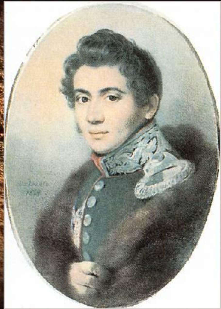
Муравьев Н.М. (1795-1843)

Никита Михайлович Муравьев - декабрист, член Северного общества, автор проекта Конституции. Проект предусматривал введение в России демократических свобод, учреждение конституционной монархии, отмену крепостного права.