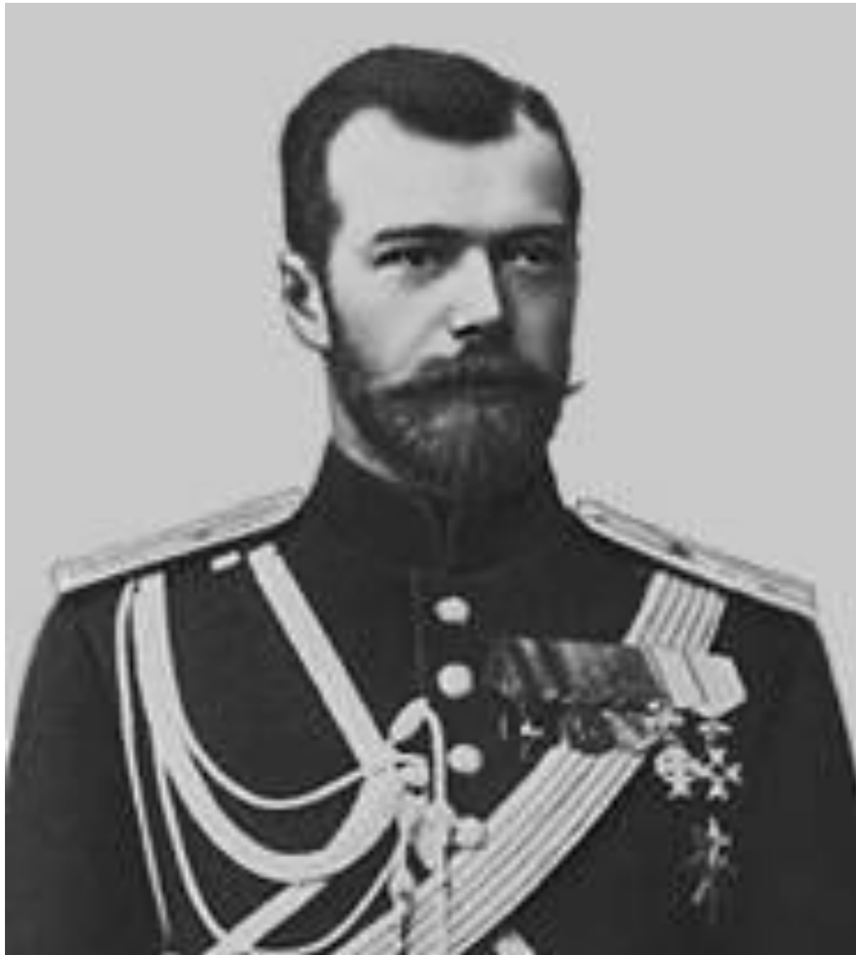
Император Николай II (1868 – 1918)