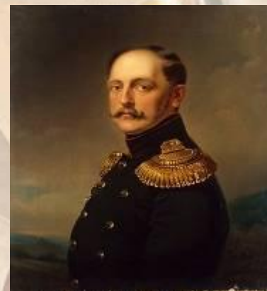
Николай I (1825 - 1855)