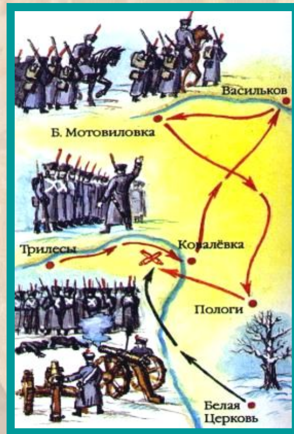
Восстание Черниговского полка.