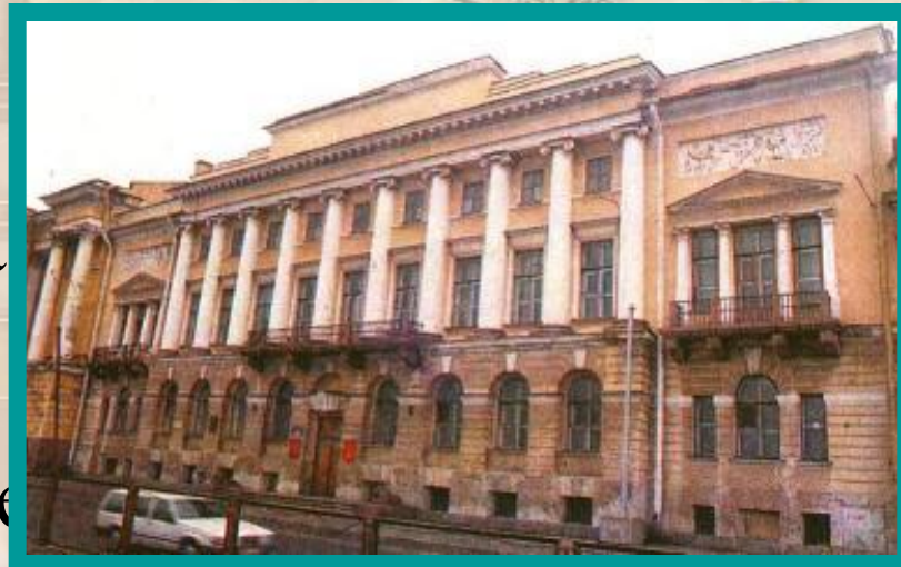
Дом в котором прошло последнее собрание декабристов