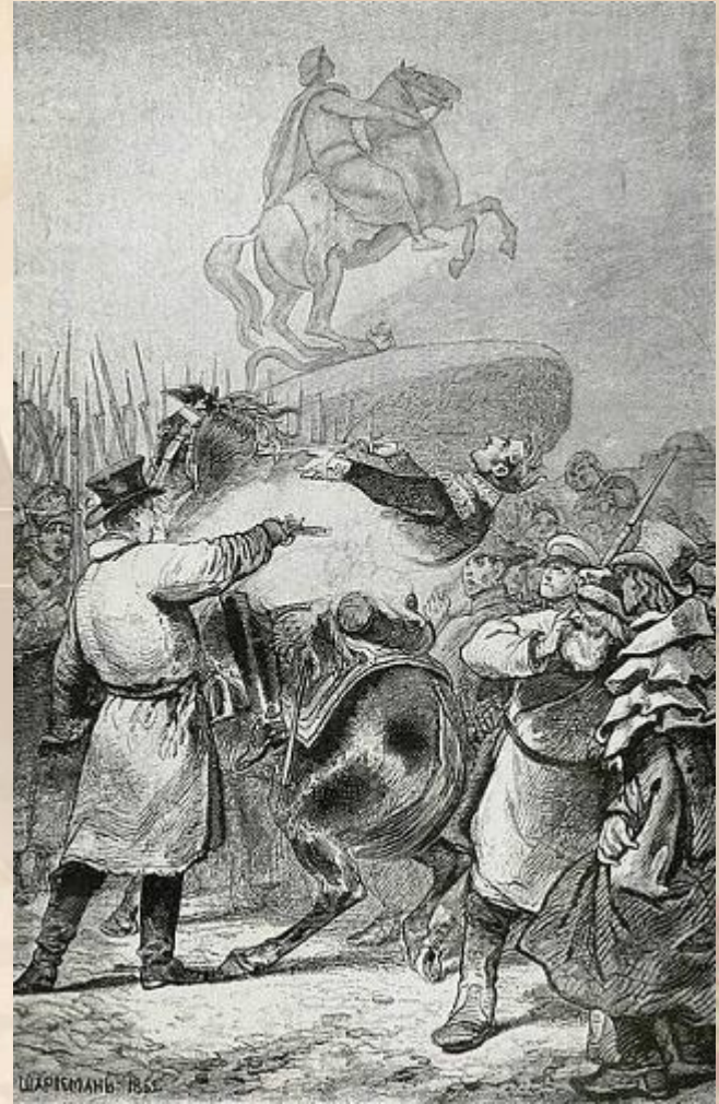
Нанесение смертельной раны М. А. Милорадовичу