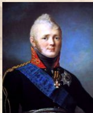
Константин – 1822 отказ от престола