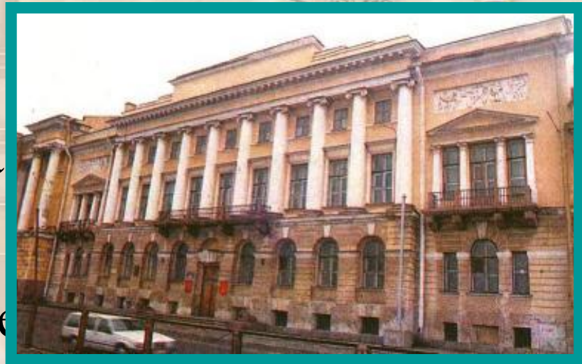
Дом в котором прошло последнее собрание декабристов