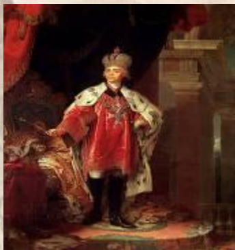
Павел I (1796 - 1801)

19 ноября 1825 г. – неожиданно умирает Александр I.