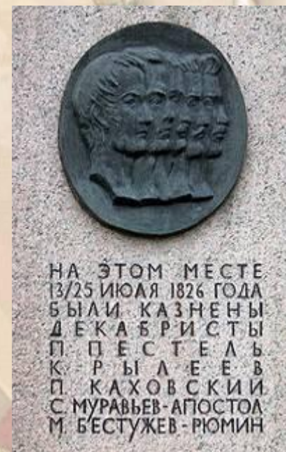
Монумент на месте казни декабристов