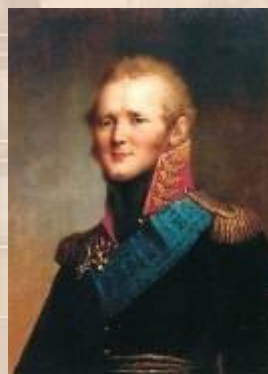
Александр I (1801 – 1825)

1797 г. – указ Павла I о престолонаследии