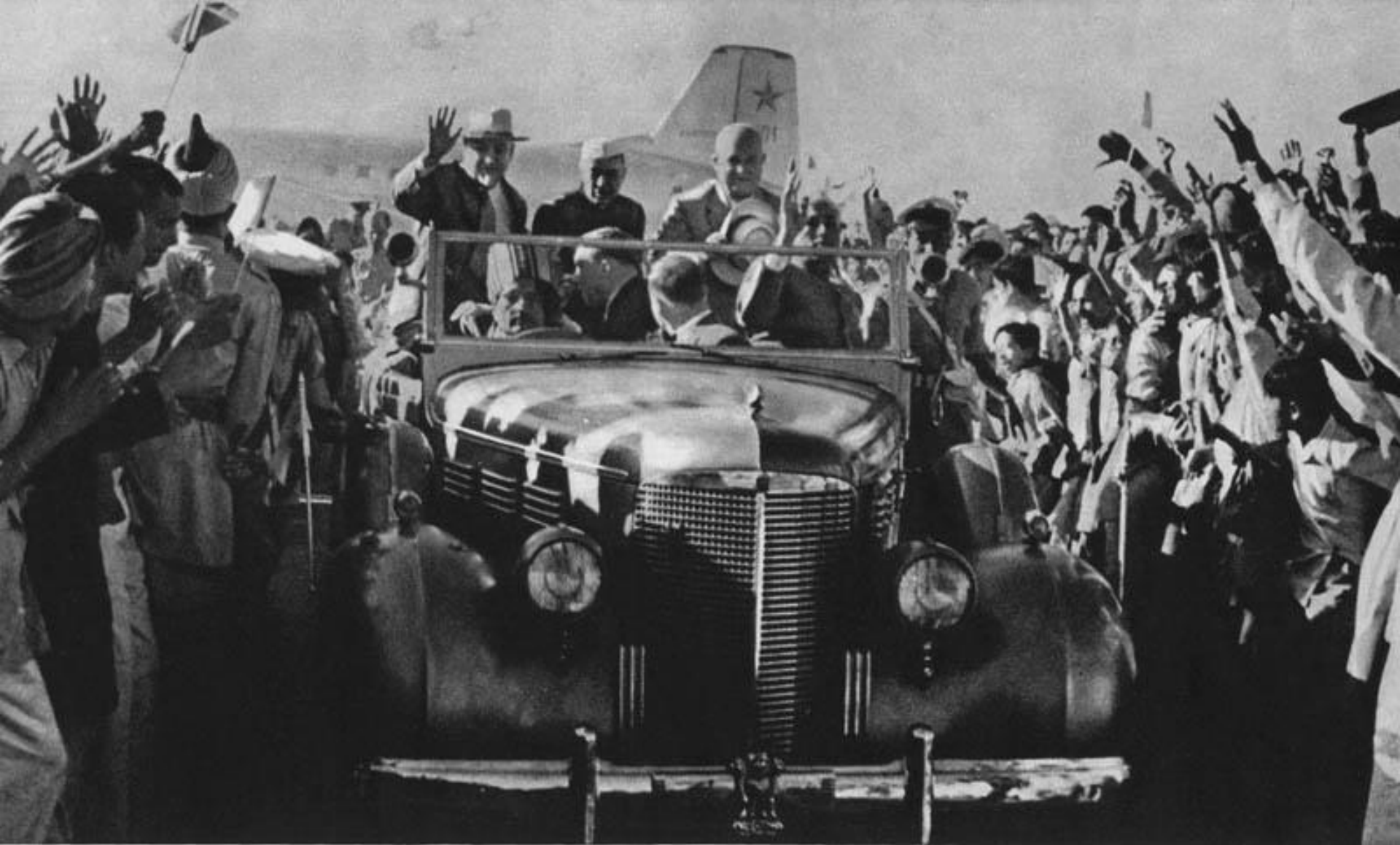
Хрущёв в Индии с Джавахарлалом Неру и Булганиным.