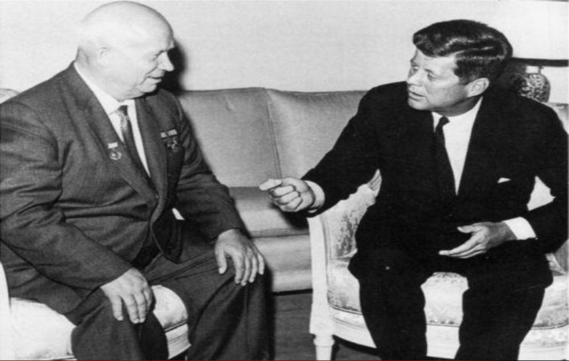
Хрущёв и президент США Джон Кеннеди на встрече.