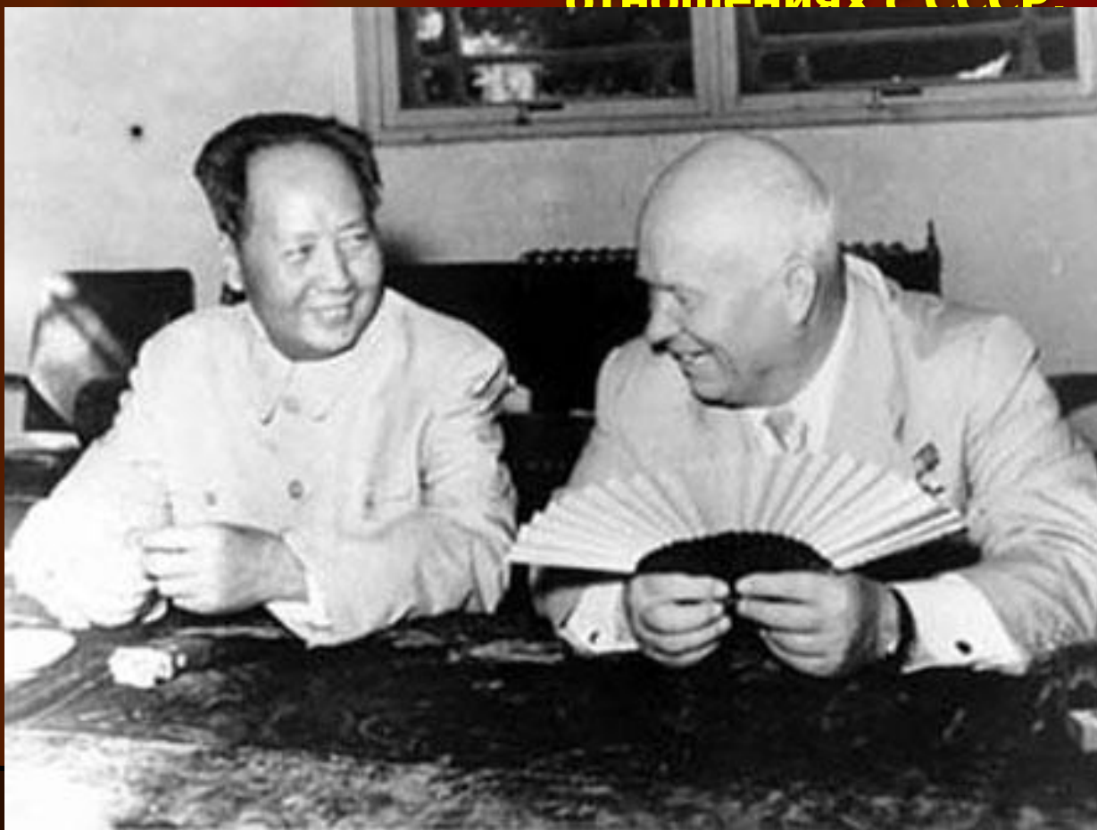
Хрущёв и китайский «Сталин» Мао Цзедун.

XX съезд ударил и в отношениях с Китаем. Китайское руководство сравнило СССР с США, за разоблачение преступлений Сталина. Отношения настолько обострились, что несколько раз происходили военные столкновения на границе. Теперь столкнулись два крупнейший коммунистических государства. Китай устал от роли «младшего брата» в отношениях с СССР.