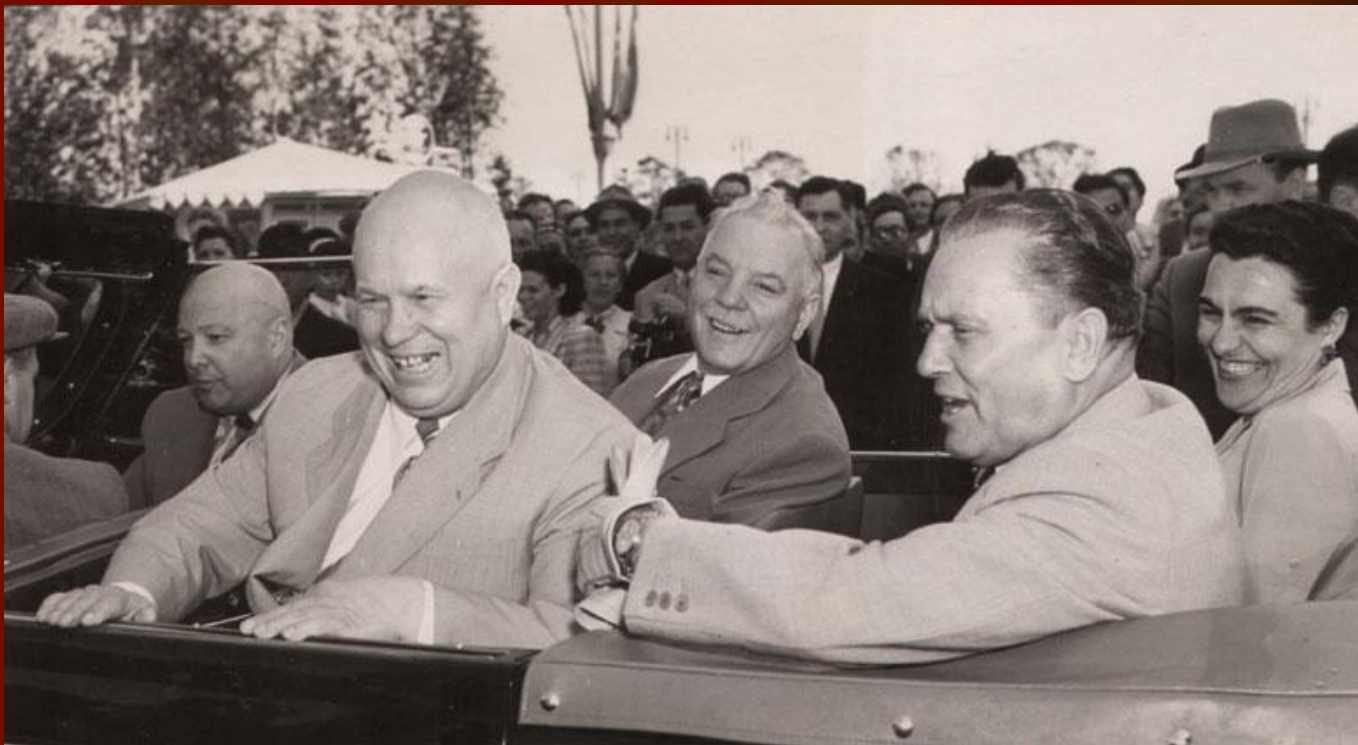
Визит Хрущёва в Югославию и встреча с президентом маршалом И.Тито.

В это время несколько улучшились отношения с Западом. Ядерное оружие приостановило возможность прямого столкновения США и СССР. В эти годы было заключено перемирие по Корее, СССР вывел войска из Австрии (1954 г.), мирный договор подписан с ФРГ, состояние войны прекратилось с Японией (1954 г.). Улучшились отношения с Югославией.