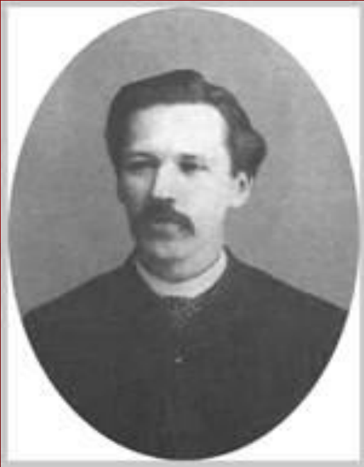
Зубатов С.В. (1864 - 1917)