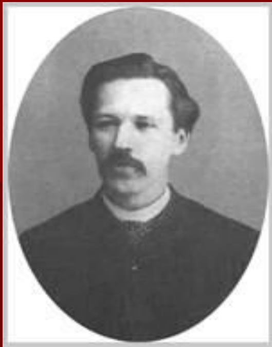
Зубатов С.В. (1864 - 1917)