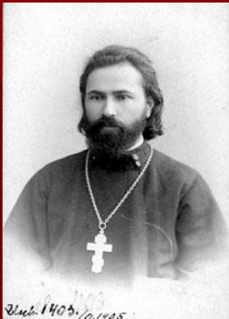
Гапон Г.А. (1870 - 1906)

Гапон Георгий Аполлонович (1870 - 1906) – священник,