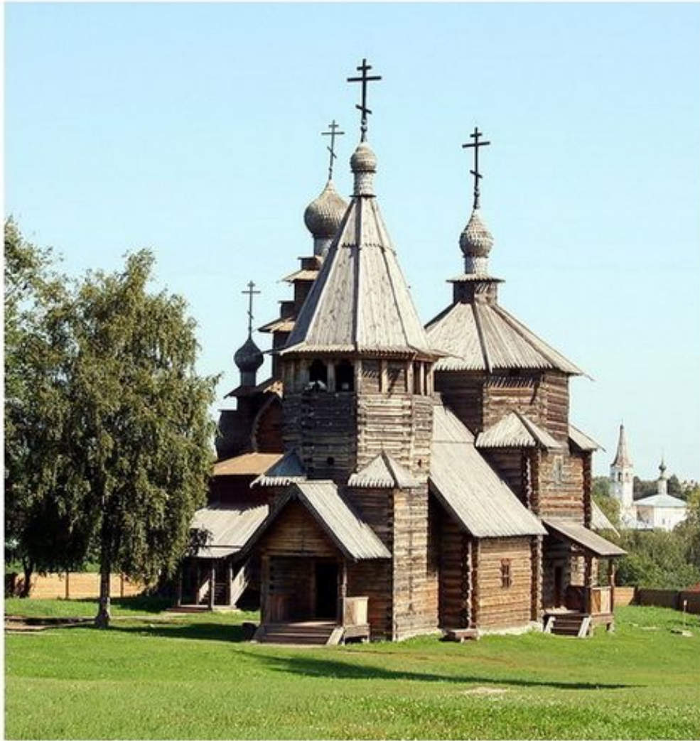
Сергей Манкелов © 2009