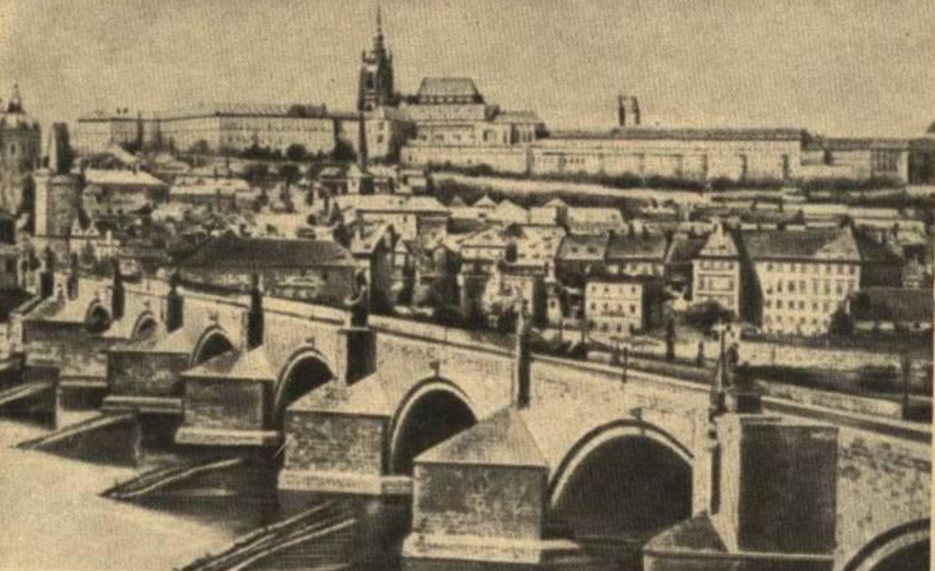
Вид Праги. На переднем плане – мост через реку Влтаву. Вдали – Пражский Кремль.