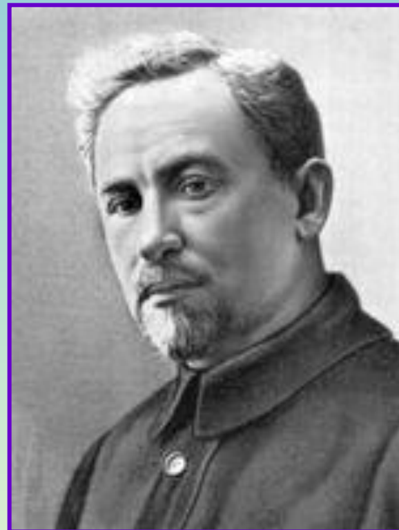
Голощёкин Ф. И.

В 1933 г. Голощёкина сняли с должности и вместо него был назначен Л.И.Мирзоян