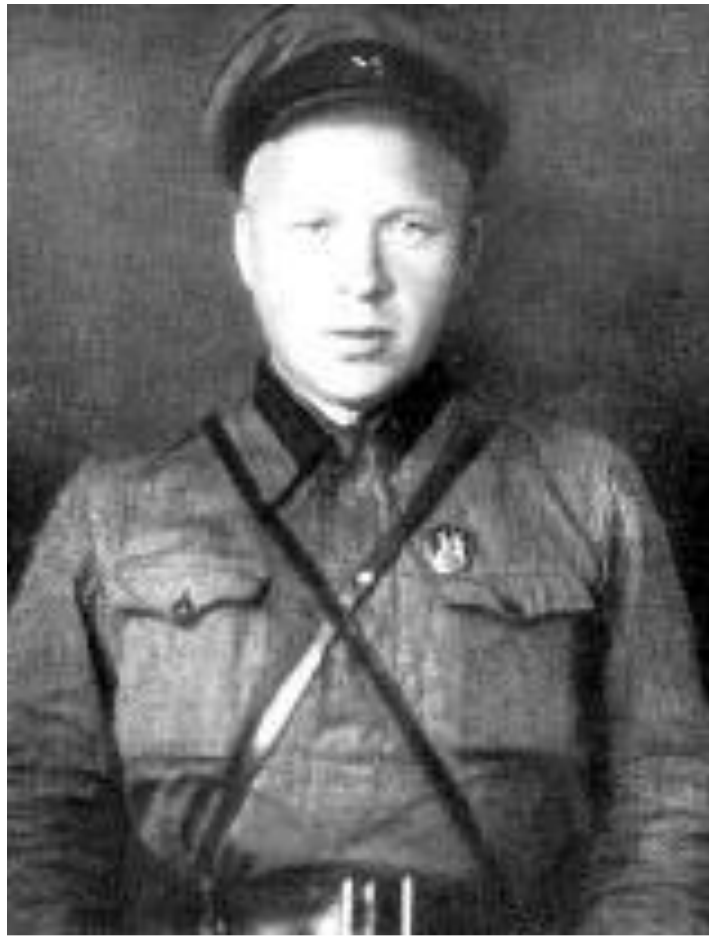
А.П.Гайдар на фронте

С первых дней войны тысячи деятелей советской культуры ушли на фронт. Защищая Родину погибли А.Гайдар и Е. Петров. Фронтовыми корреспондентами работали М.Шолохов, К.Симонов, А.Фадеев и др. В осажденном Ленинграде продолжали работать О. Бергольц, В.Инбер, Д. Шостакович. События тех дней нашли отражение во «Фронтовых дневниках» К.Симонова, И.Эрен