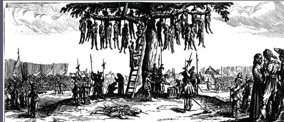
Après un Crime A la fin des douleurs infames et perdus Comme fruits malheureux à cet arbre pendus Monstrent bien que le crime horrible et noir'e engeance E'st les mêmes instrument de honte et de'sonpeance Et que c'est le Destin des hommes vicieux De poursuivre tost ou tard la justice des Cieux