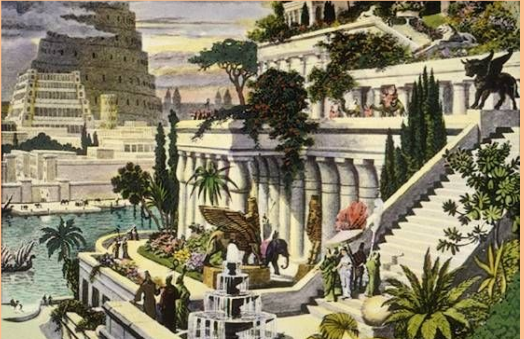
Висячие сады царицы Семирамиды, жены царя Навуходоносора