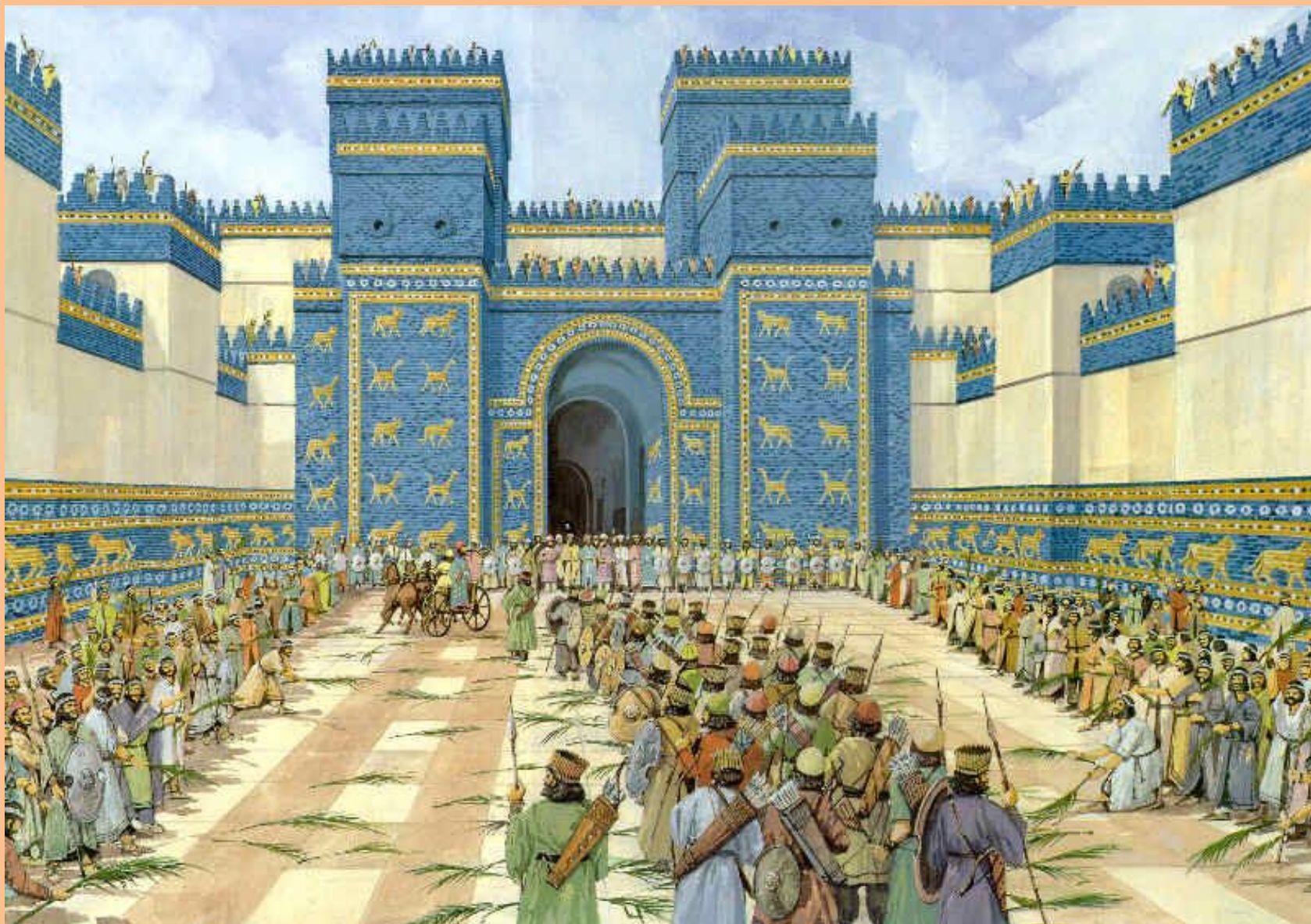
Ворота Богини Иштар