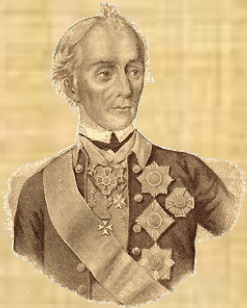
Александр Васильевич Суворов