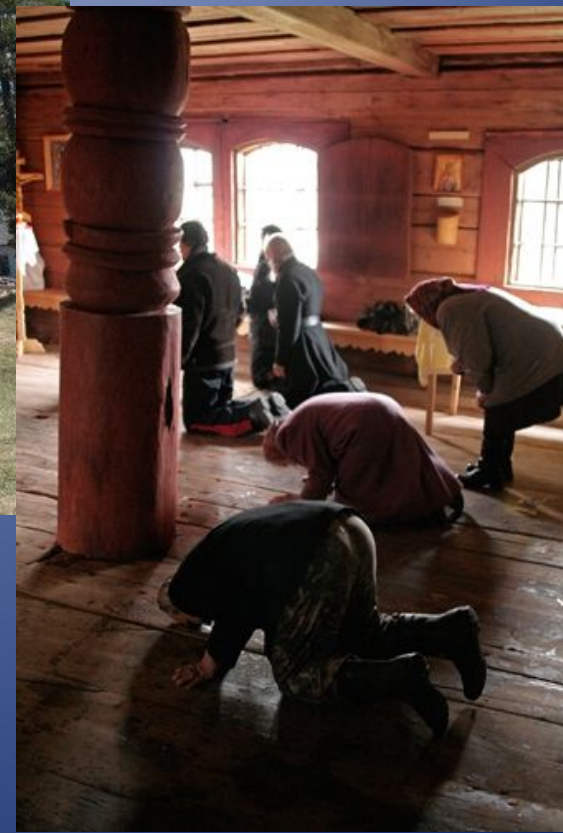
Юксовичи (Родионово). Церковь Георгия Победоносца XVI век