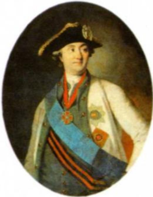
Портрет графа А. Г. Орлова- Чесменского. 1779 г. Худ. К. Христинек