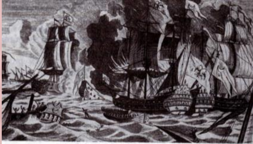
Бой в Хиосском проливе — первый этап Чесменского сражения. Гравюра XVIII в.