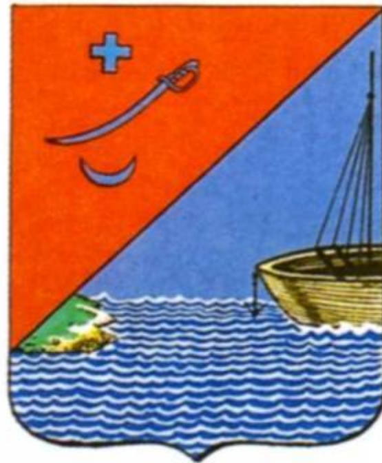
Герб г. Измаила