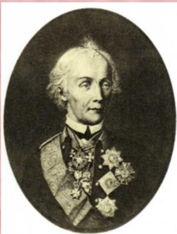
А. В. Суворов.