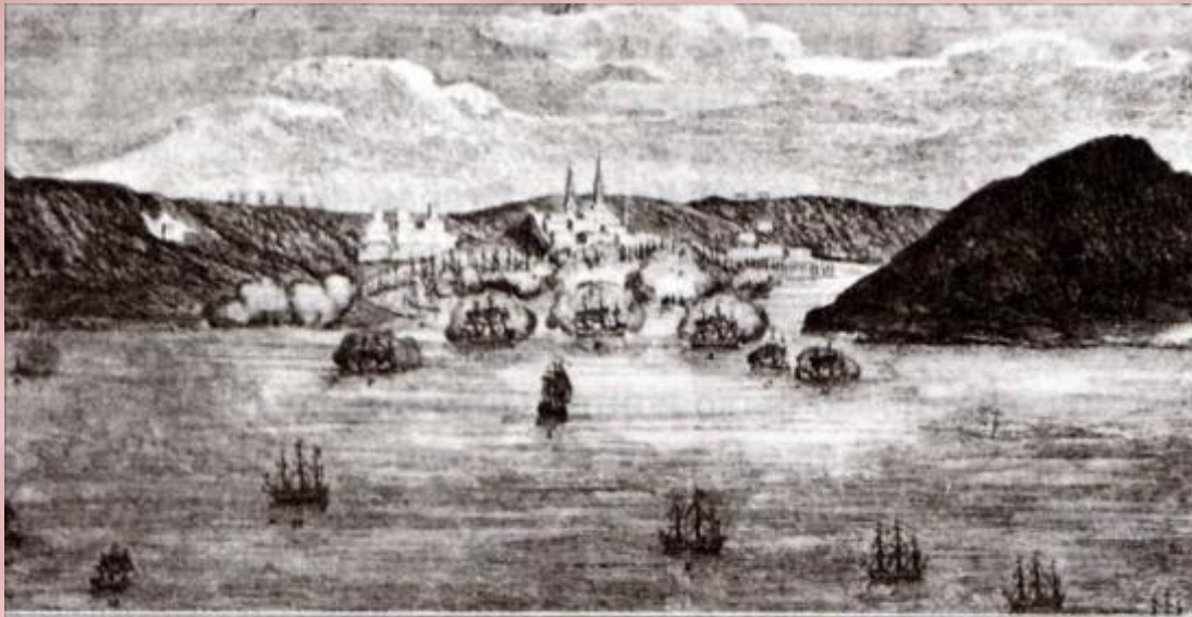
Чесменский бой. Гравюра. XVIII в.