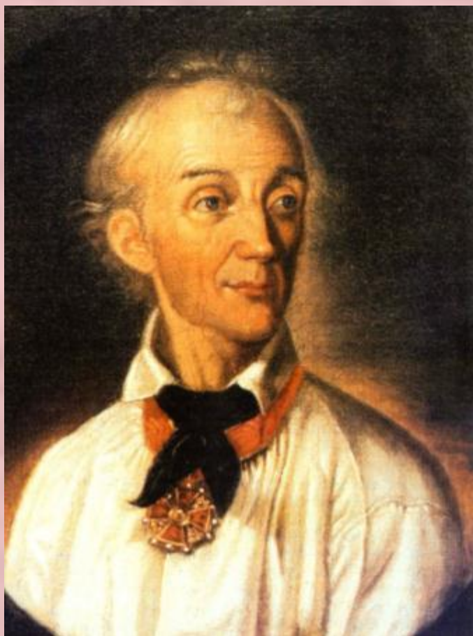
Генерал-фельдмаршал А.В. Суворов-Рымнинский