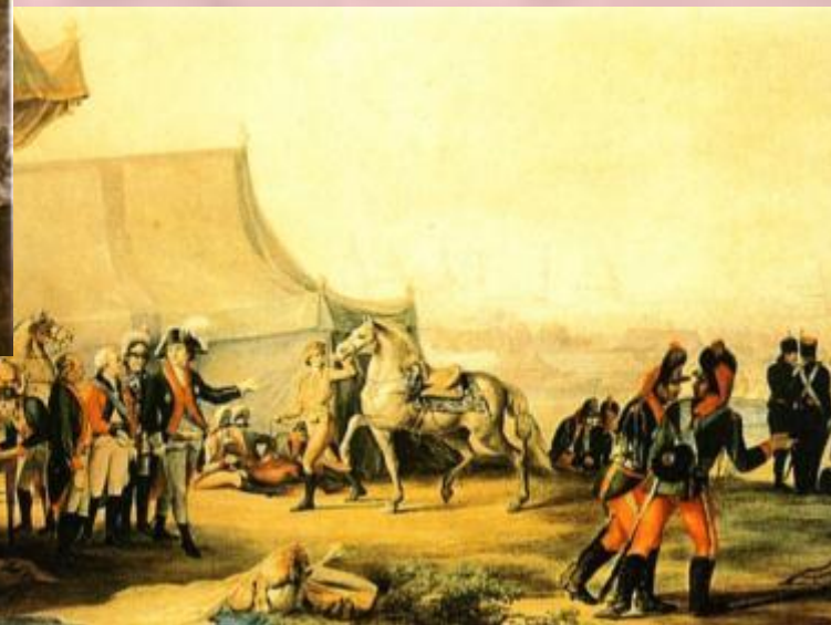
Лагерь Потёмкина под Очаковым.