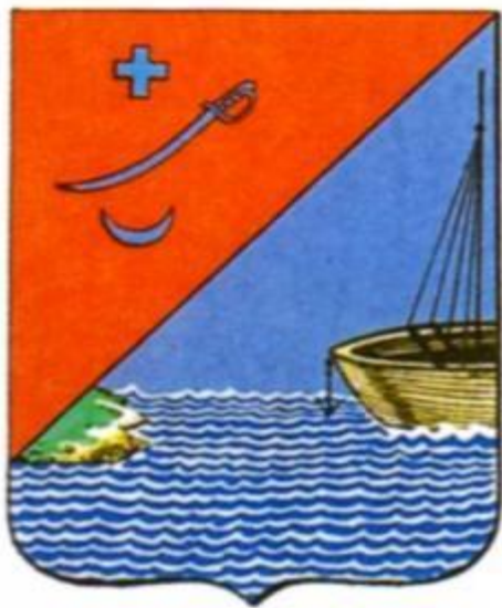
Герб г. Измаила