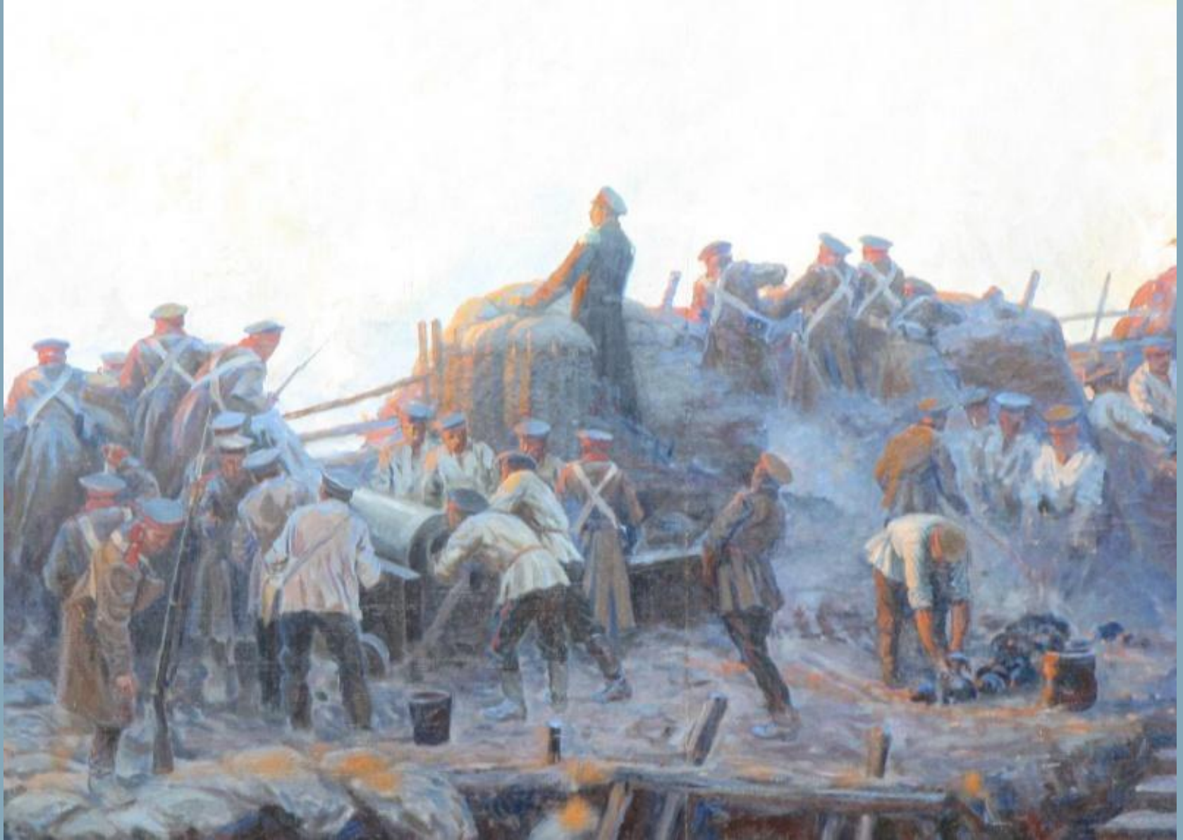
Адмирал Павел Степанович Нахимов на гласисе оборонительной башни Малахова кургана в Севастополе. Фрагмент панорамы «Оборона Севастополя 1854-1855 гг.»