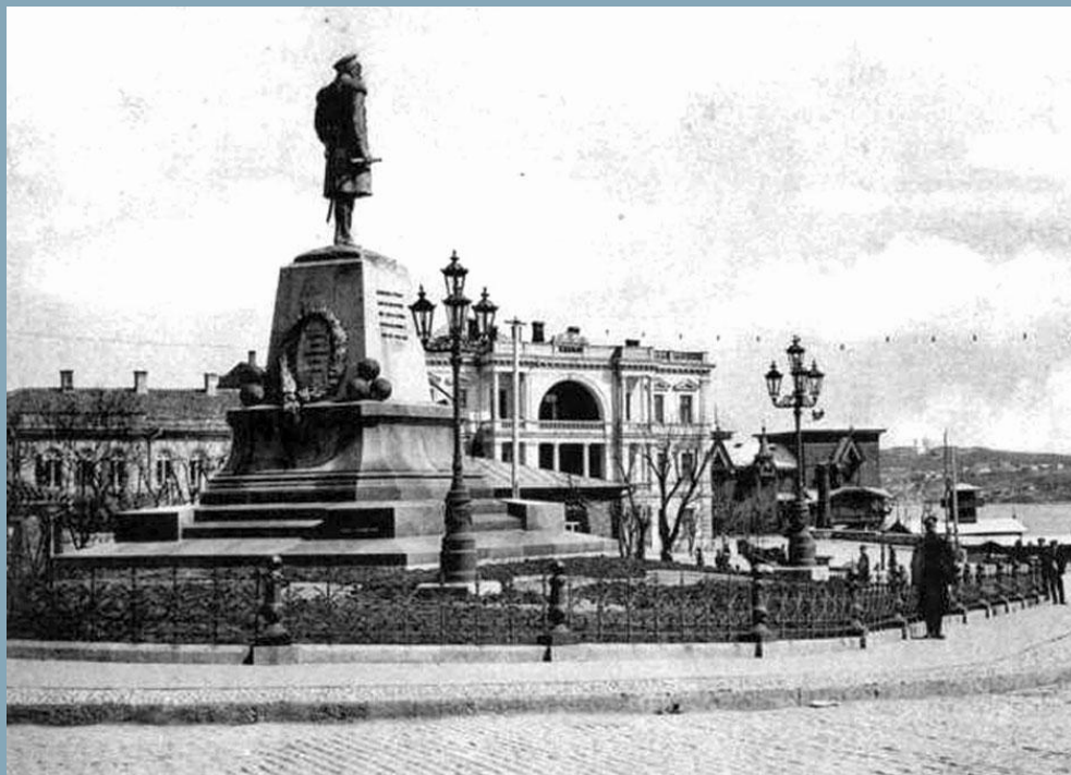
Памятник Нахимову. Севастополь. Поставлен в 1898г. Демонтирован в 1928г.