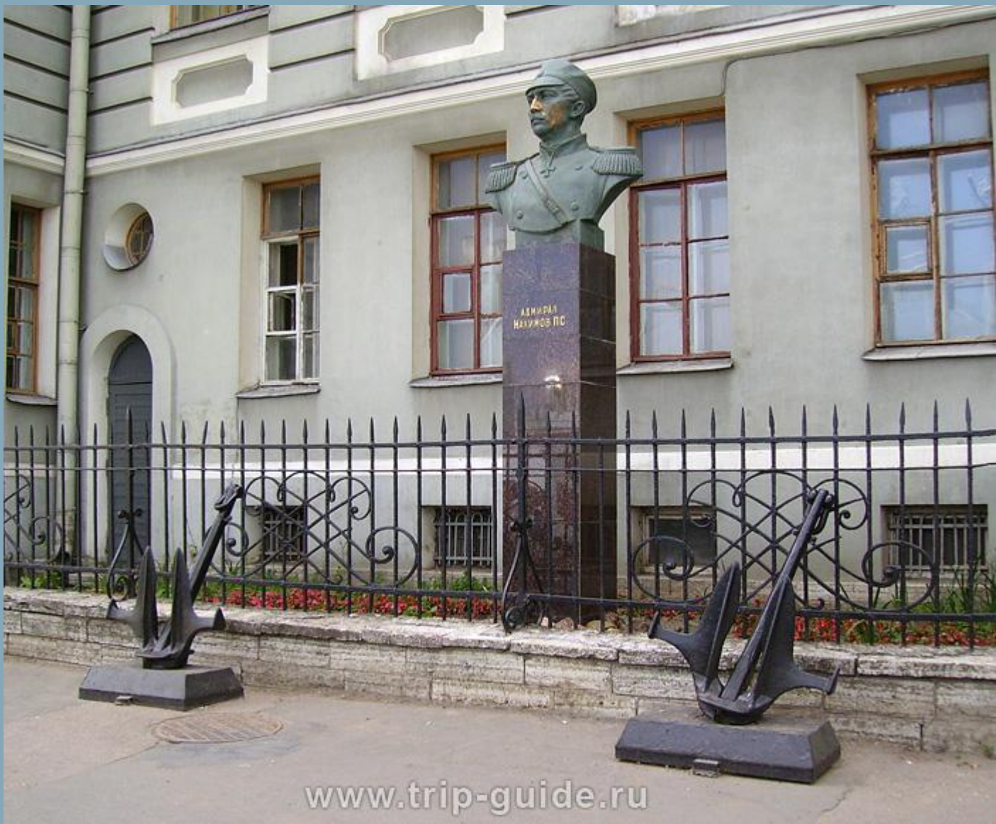
Нахимов П.С. Санкт-Петербург. Здание Нахимовского училища