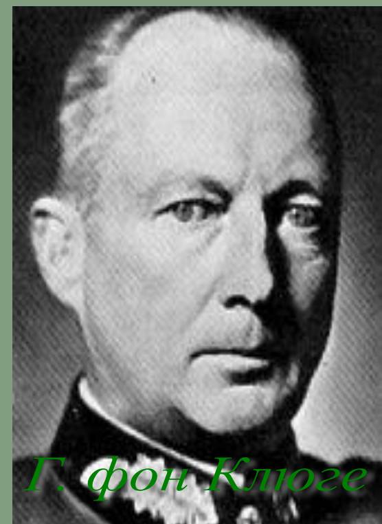
Г. фон Клюге