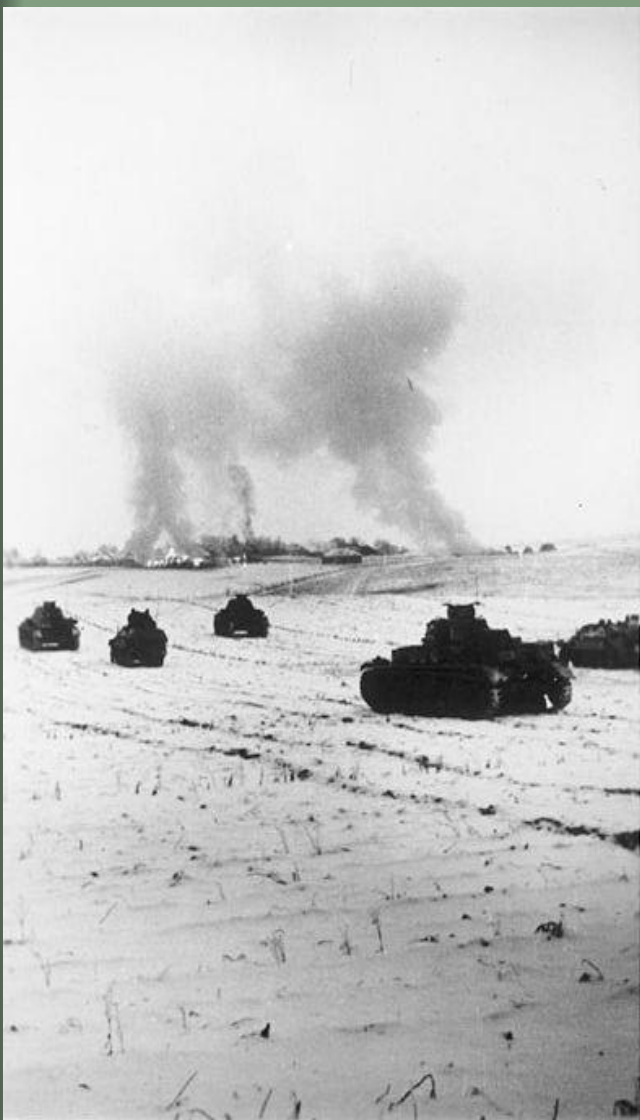
25. November 1941