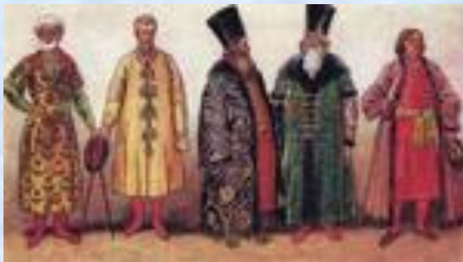
Бояре. 17 век.