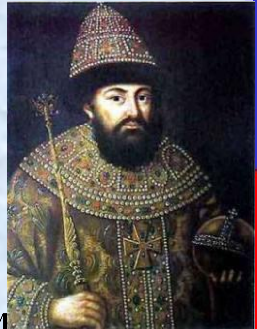
Царь Миколай I