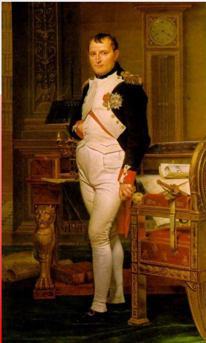
Наполеон – император Франции