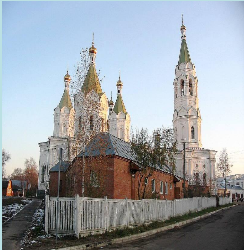
Город Егорьевск. Церковь Александра Невского.