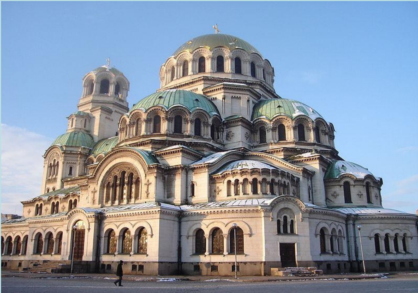
Собор Александра Невского в Софии