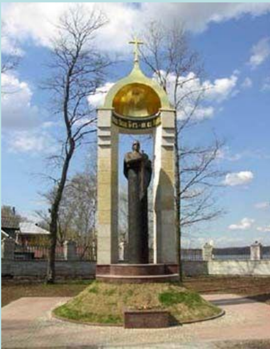
Усть – Ижора. Церковь Александра Невского.