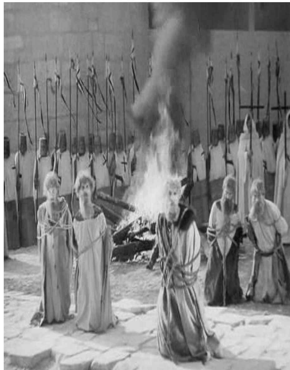
Битва на Чудском озере. «Ледовое побоище»