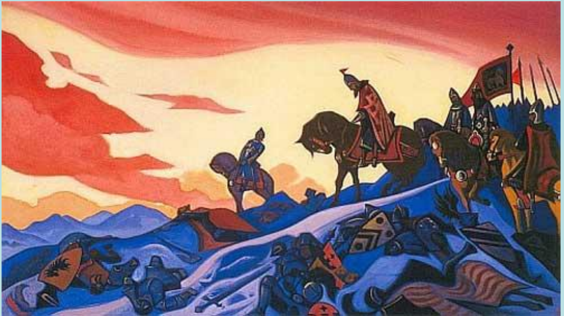
Николай Константинович Рерих