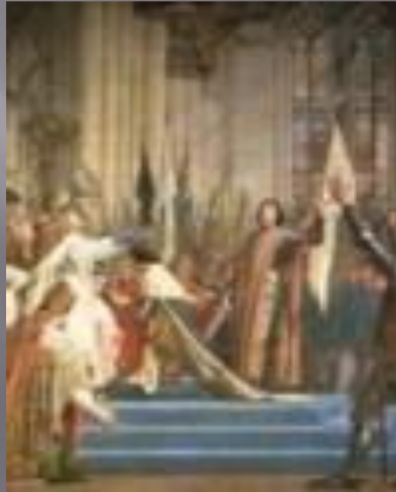
Здание городской ратуши в Реймсе. Место коронации Карла VII.