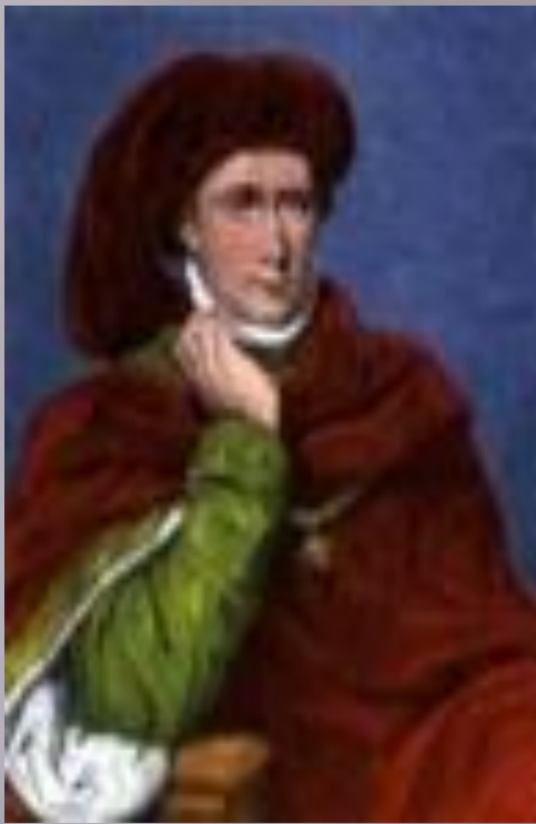
Карл VI, Безумный