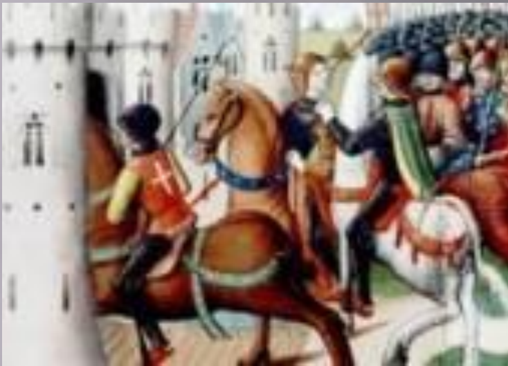
«Взятие Жанны д'Арк в плен.» Миниатюра из рукописи XV века.