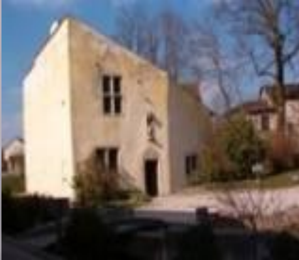
Дом Жанны д'Арк в Домреми. Ныне — музей