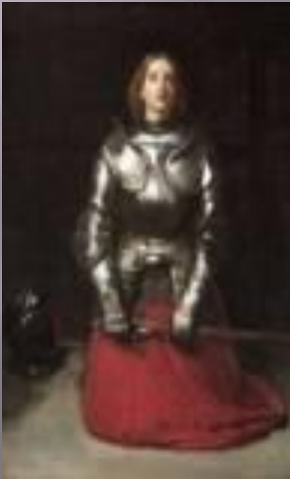
П. Рубенс. "Жанна за молитвой". Около 1620 года.