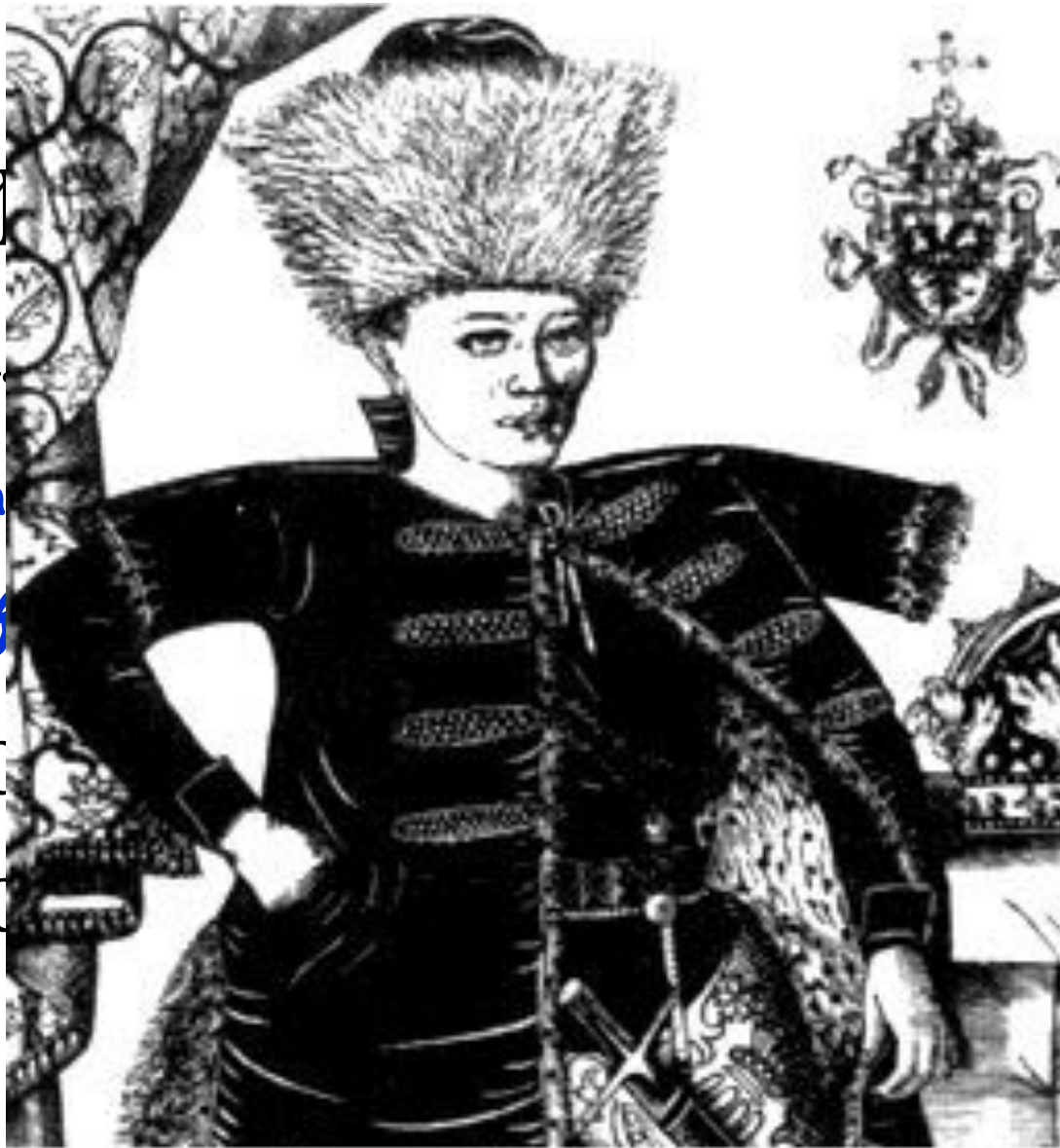
"Дмитрий Самозванец". Гравюра Ф. Снядецкого. XVII в.