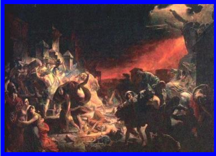
К.Брюллов. Последний день Помпеи

В живописи происходит отказ от библейских сюжетов классицизма и рост интереса к личности простых людей.