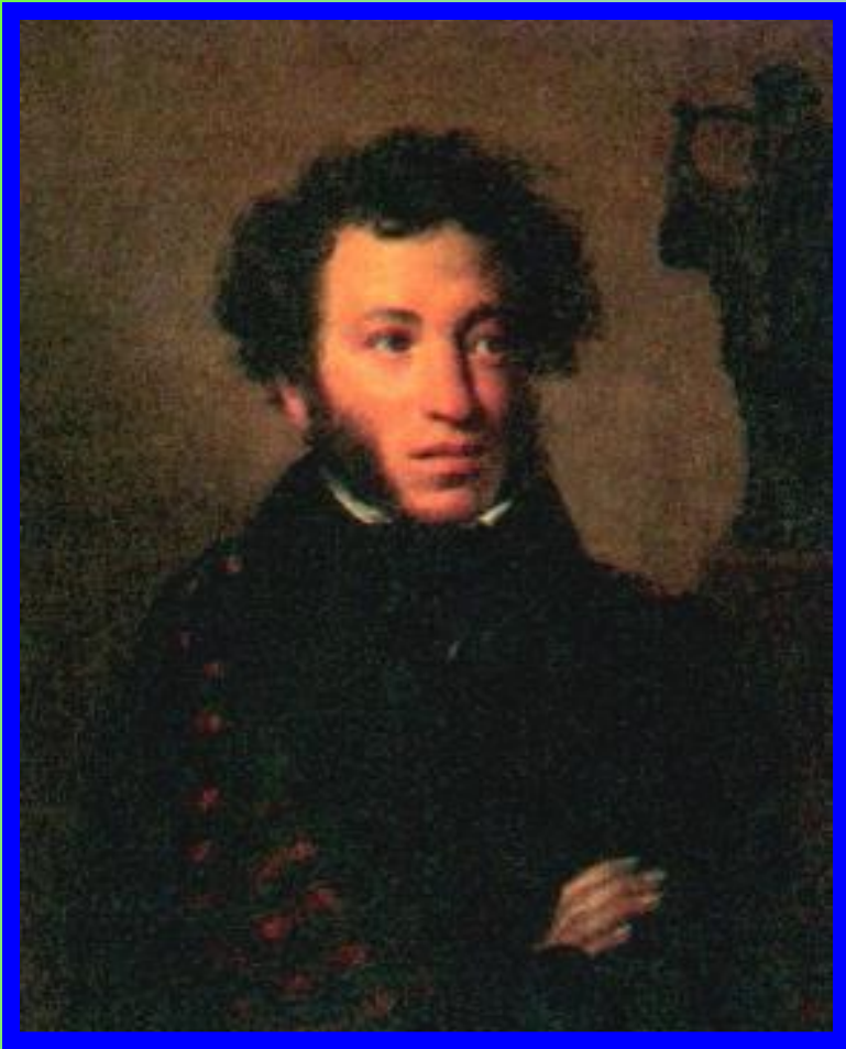
О.Кипренский Портрет А.С.Пушкина

В к. 20-х гг.наметился переход к новому направлению- реализму. Он проявился уже в трудах «позднего» Пушкина- «Борисе Годунове», «Капитанской дочке», «Дубровский»,«Медный всадник», и в романе М. Лермонтова «Герой нашего времени».