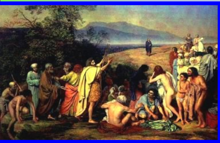
А.А.Иванов Явление Христа народу.

Особое место в истории русской живописи занимает А.Иванов- «портретист Христа». Над главным творением жизни, «Явлением Христа народу», он работал 20 лет. Основная идея картины уверенность в необходимости нравственного обновления людей.