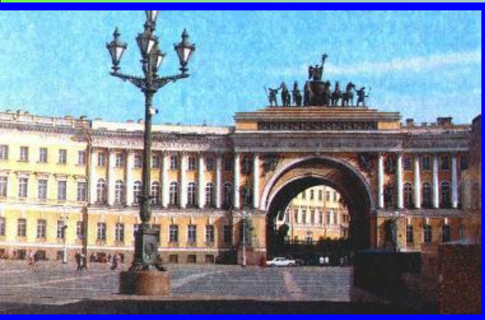
К.Росси Арка здания Генерального штаба.

Наиболее значительный вклад в архитектуру внесли А.Захаров, А. Воронихин