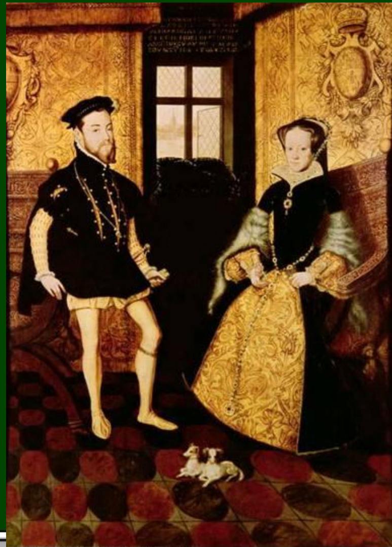
King Philip II and Queen Mary I, 1558 by Hans Eworth, Woburn Abbey, UK.