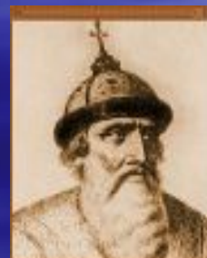
Владимир Мономах (1113-1125)