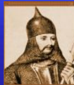
Олег Вещий (Киевская Русь) 912-945