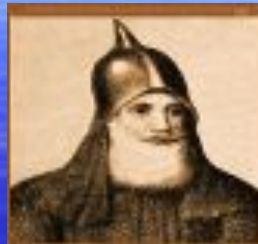
Рюрик (Новгород) 862-879