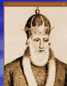
Владимир Красное Солнышко (Святой) (980-1054)