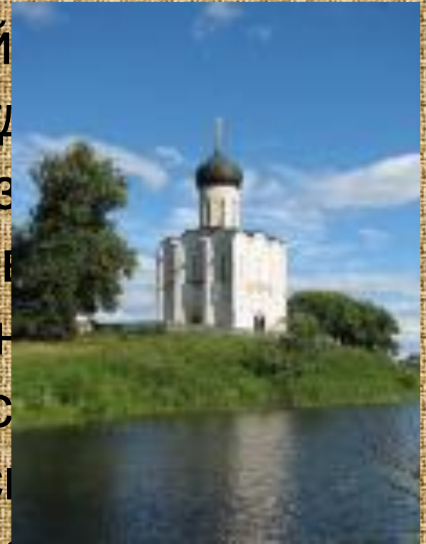
Владимир Церковь Дронова на Нерли 1165г.