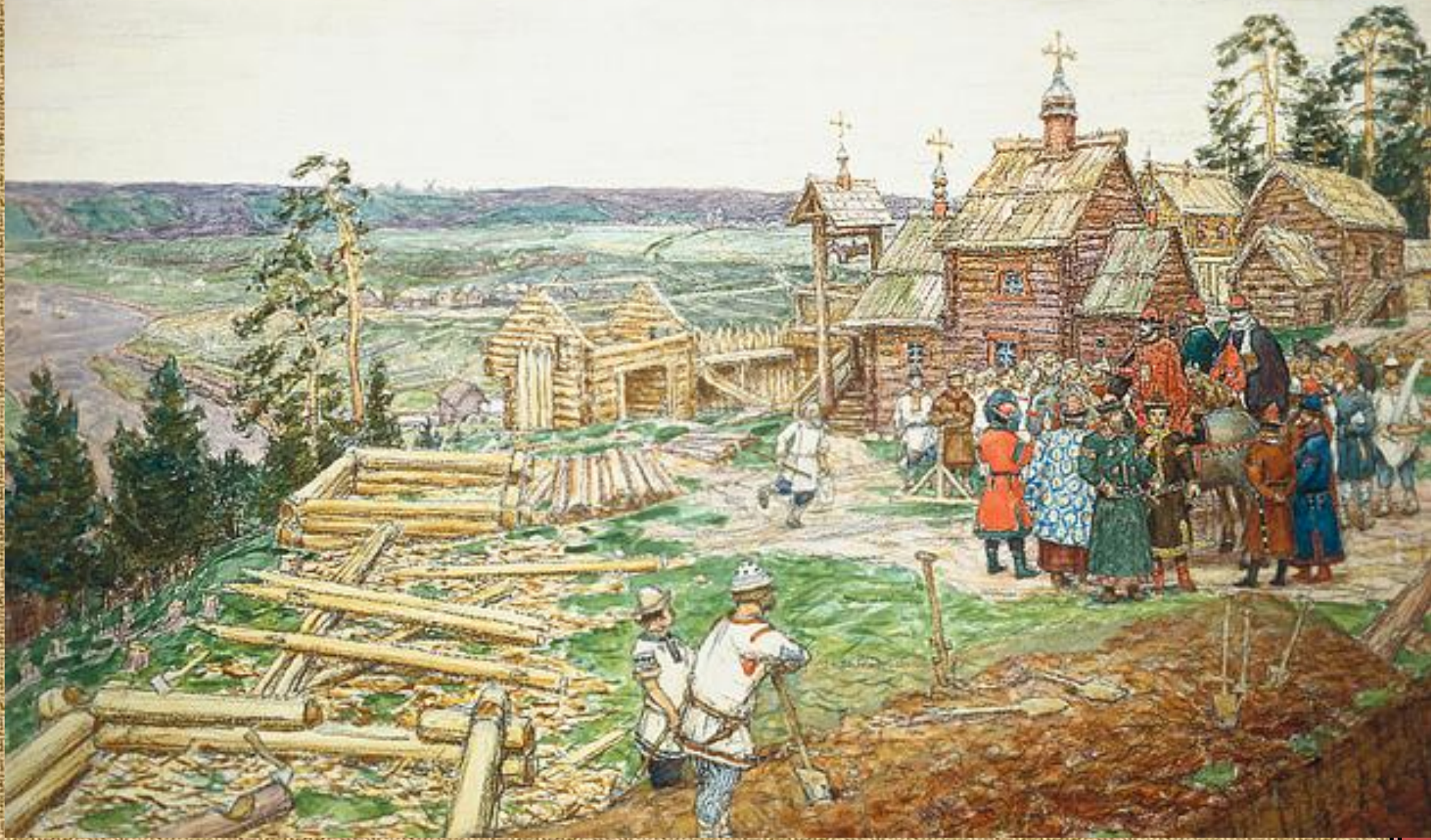
А. М. Васнецов. Основание Москвы. Постройка первых стен Кремля Юрием Долгоруким в 1156 г.