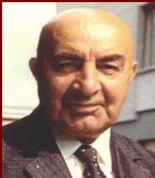
Мухаммед Дауд Хан

Двоюродный брат короля. 27 апреля 1978г. Дауд был свергнут в результате военного путча, проведенного фракциями коммунистической партии, объединившимися под названием «Народно-Демократическая Партия Афганистана».