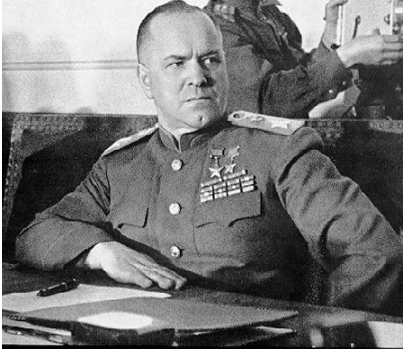
Г. К. Жуков