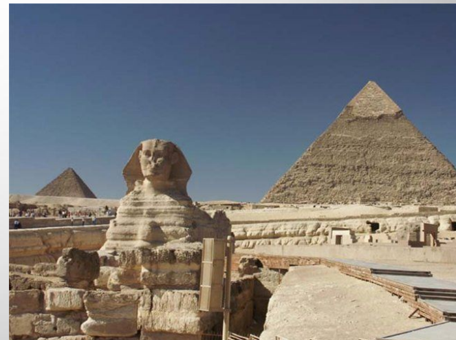
Египет - это древнейшая цивилизация