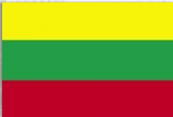
Литовская республика 1920 г.