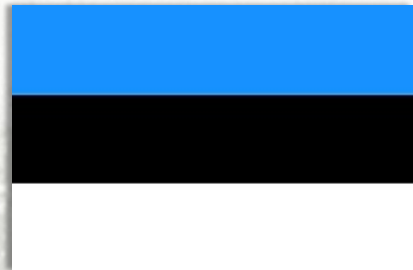
Эстонская республика 24 февраля 1918 г.

На территории прибалтийских республик происходило противоборство буржуазно-националистических и пролетарско-революционных сил. В 1919-1920 гг. в Латвии, Литве и Эстонии утвердились буржуазно-демократические республики