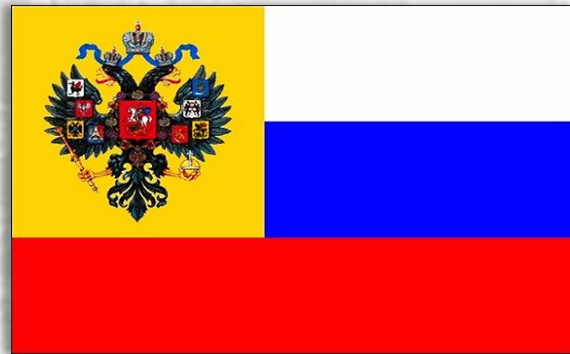
Россия Монархия была свергнута