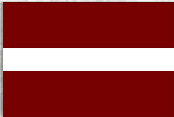
Латвийская республика 18 ноября 1918 г.