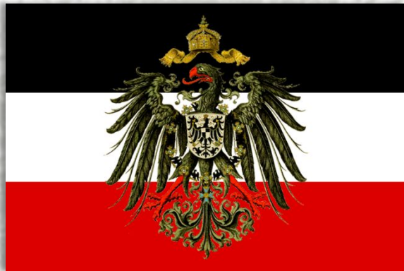
Германия Стала республикой.

В результате войны перестали существовать 4 империи :