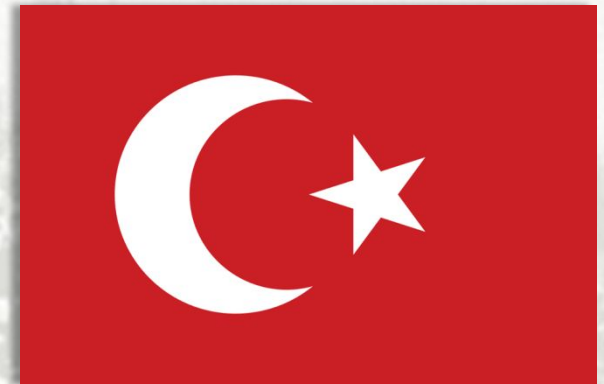
Османская империя развалилась