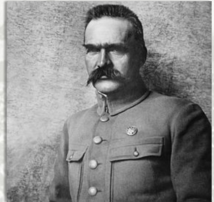
Юзеф Пилсудский – глава Польской республики

Уже в первые дни германской революции 6 ноября 1918 г. в оккупированной Польше было создано Временное правительство. В декабре 1918 г. были присоединены западные польские земли. Другие земли отошли по Версальскому мирному договору. Формирование Польши как республики завершилось в марте 1922 г. с принятием конституции.