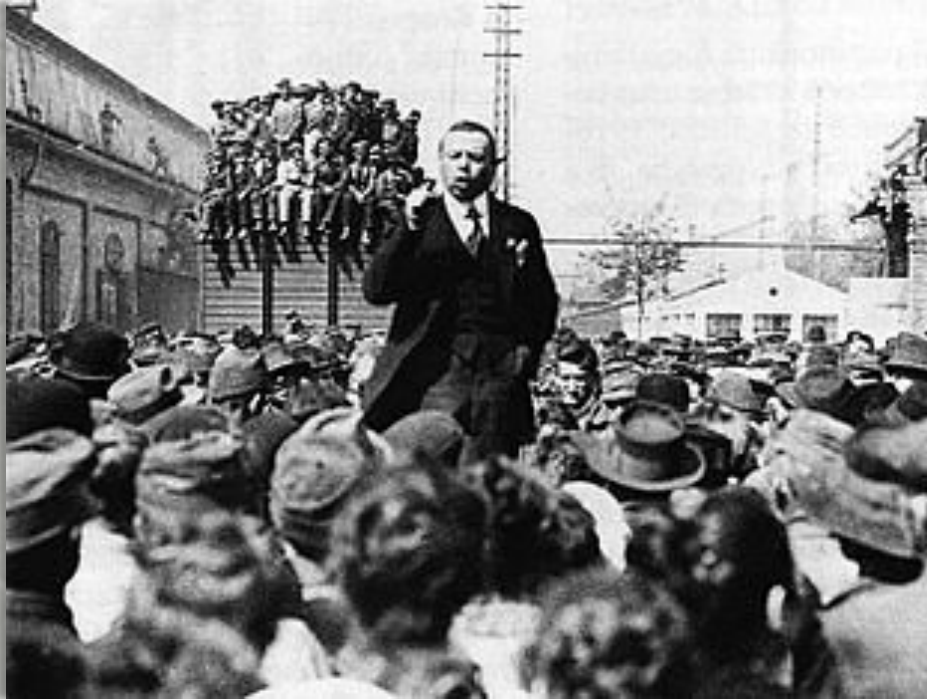
Бела Кун выступает на митинге 1919 года

После войны Венгрия считалась побежденной и должна была отдать Трансильванию. Правые не согласились с этим и отдали власть социал-демократам. Новое правительство, под влиянием коммунистов, хотевшим опереться на Россию, 21 марта 1919 г. провозгласило Венгрию Венгерской советской республикой.