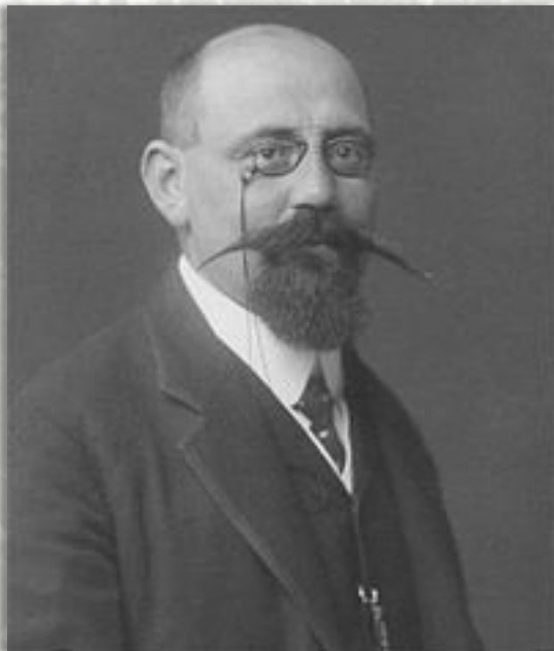
Карл Реннер рейхсканцлер Австрии

Австро-Венгерская империя подписала перемирие с Антантой