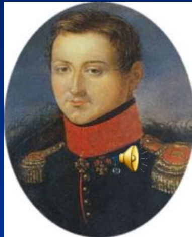
С. И. Муравьев-Апостол.