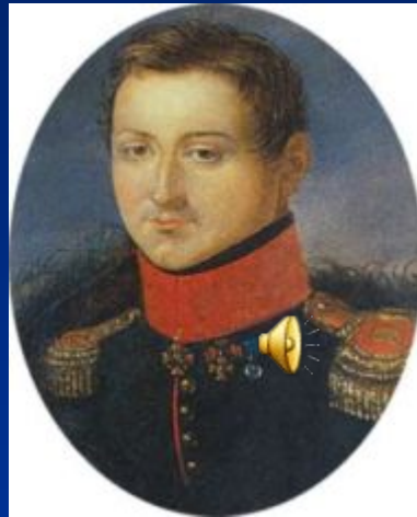
С. И. Муравьев-Апостол.