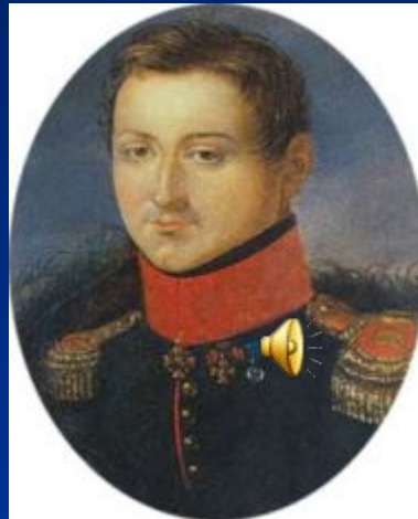
С. И. Муравьев-Апостол.