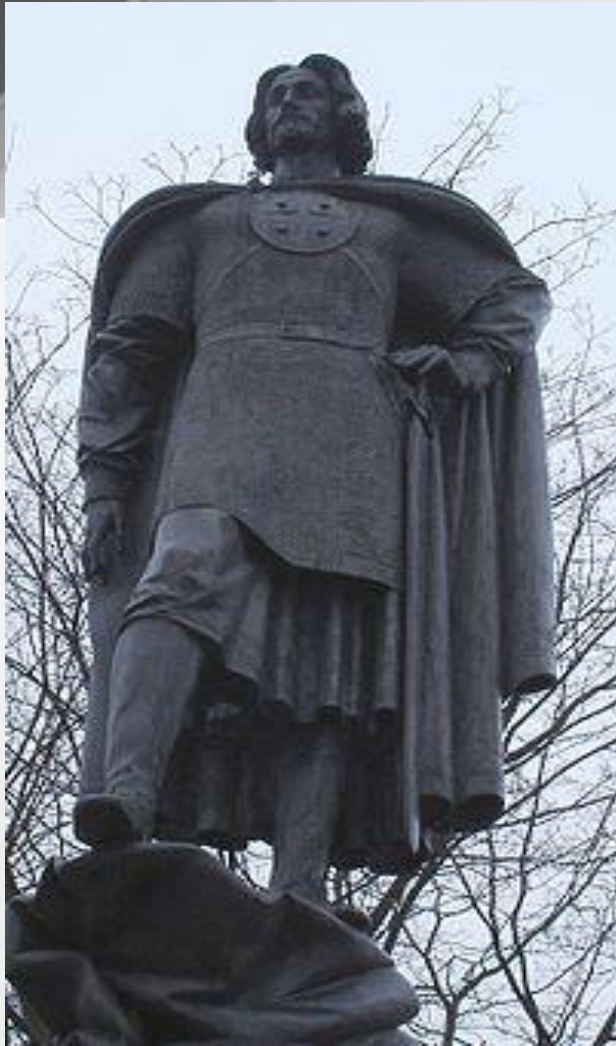
• Памятник в Санкт-Петербурге (Усть-Ижора)