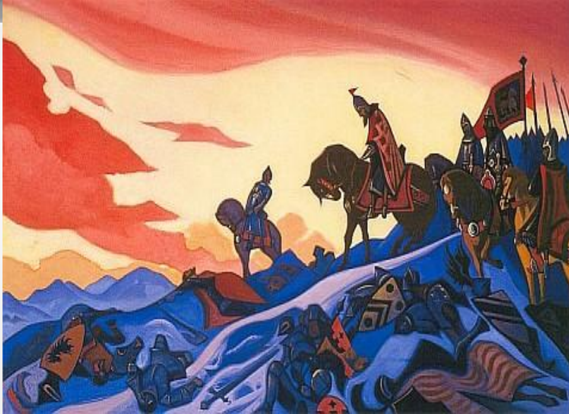
«Александр Невский». 1942 Николай Константинович Рерих

Под ними лошади тонули, Под ними дыбом лед вставал, Их стремяна на дно тянули, Им панцирь выплыть не давал.