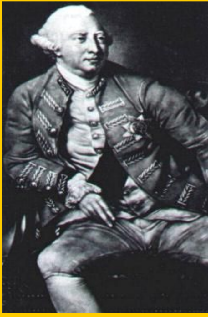
Король Георг III. Гравюра 18 в.

Король запретил пере-селение на новые земли, переработку в колониях сырья, вы-воз шерсти и желе-за, ввоз машин, их моделей и чертежей. Торговать колонии могли только с Анг-лией.