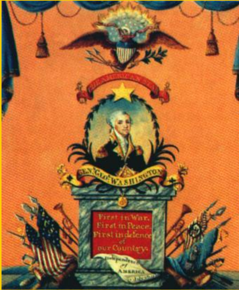
Вашингтон-герой. Гравюра н.19 в.

Зимой 1774 г колонис-ты стали вооружать -ся. Они созвали Кон-тинентальный конг-ресс ставший прави-тельством.