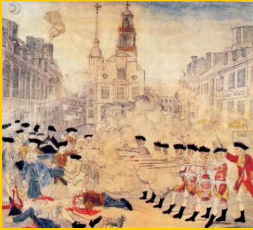
Неизвестный художник. Бостонский расстрел.

Тогда колонисты бойкотировали английские товары и парламент отменил все пошлины, кроме «чайной».