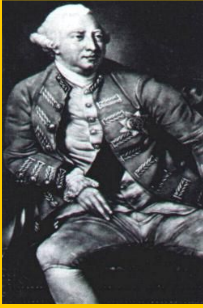
Король Георг III. Гравюра 18 в.

Король запретил пере-селение на новые земли, переработку в колониях сырья, вы-воз шерсти и желе-за, ввоз машин, их моделей и чертежей. Торговать колонии могли только с Анг-лией.