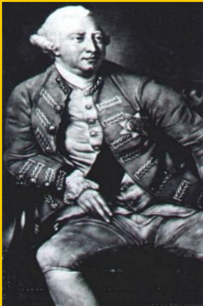
Король Георг III. Гравюра 18 в.

Король запретил пере-селение на новые земли, переработку в колониях сырья, вы-воз шерсти и желе-за, ввоз машин, их моделей и чертежей. Торговать колонии могли только с Анг-лией.