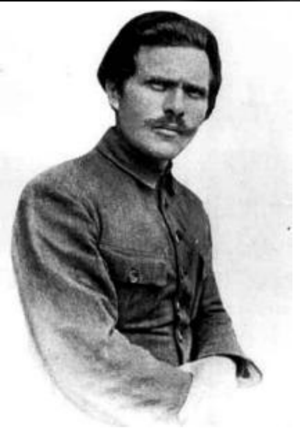
Нестор Махно (1888 -1934 г.г.)

Украина – отряды «батьки Махно» Н.И.Махно – в юности увлёкся идеями анархизма, после революции в Гуляй-Поле (Украина) крестьяне под его руководством провели «чёрный передел» земли.