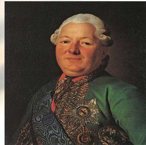
Васи́лий Миха́йлович Долгору́ков-Кры́мский