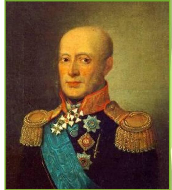
Михаил Богданович Барклай-де-Толли (1761 - 1818)

Генерал-фельдмаршал, князь. Он был участником русско-турецкой 1787 - 1791 гг. и русско-шведской 1788 1790 гг. войн. В войне с Францией 1806 - 1807 гг. и русско-шведской войне 1808 - 1809 гг. командовал дивизией и корпусом. В 1810 - 1812 гг. - военный министр России. В ходе Отечественной войны 1812 г. возглавлял 1-ю Западную армию. В Бородинском сражении командовал правым крылом и центром русских войск, а в заграничных походах 1813 - 1814 гг. возглавлял объединенную русско-прусскую армию. Успешно руководил ею в сражениях под Торном, Кульмом и Лейпцигом. М.Б. Барклай-де-Толли родился 16 декабря 1761 г.