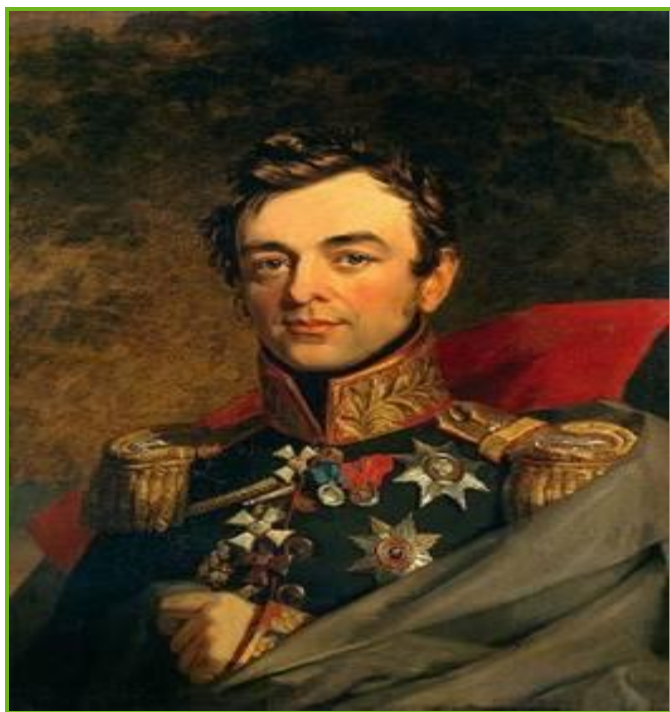
Иван Федорович Паскевич