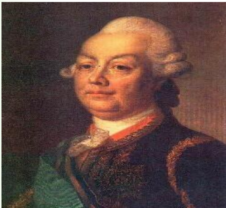
Пётр Александрович Румя́нцев-Задуна́йский