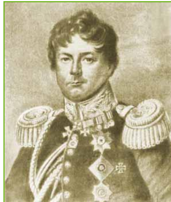
Иван Иванович Дибич-Забалканский (1785 - 1831)

Генерал-фельдмаршал, граф, участник войн с Францией 1805 - 1807 гг. и Отечественной войны 1812 г. Во время заграничного похода Русской армии 1813-1814 гг. - оберквартирмейстер корпуса, генерал-квартирмейстер армии и союзных русско-прусских войск. С 1815 г. - начальник штаба 1-й армии, с 1823 г. - начальник Главного штаба. В русско-турецкую войну 1828 - 1829 гг. - главнокомандующий Русской армией.