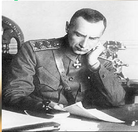
Верховный Правитель России и Верховный Главнокомандующий Русской армией адмирал А. В. Колчак