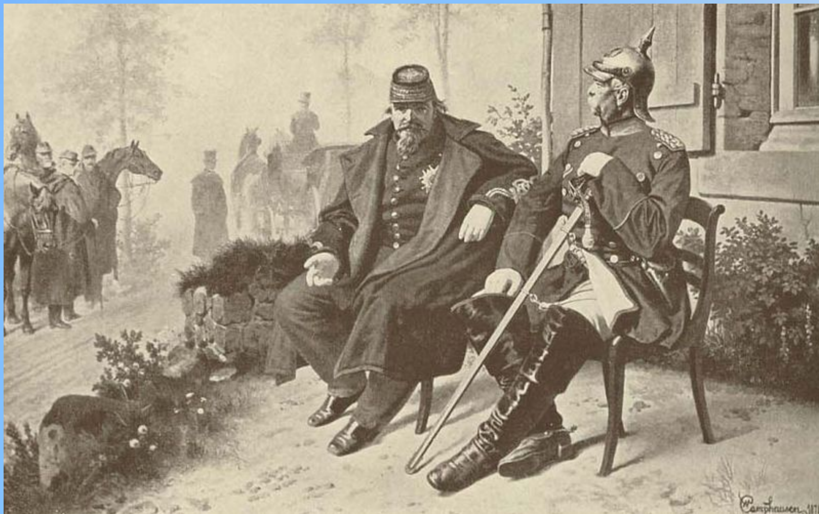
Наполеон III в плену у Бисмарка в 1870