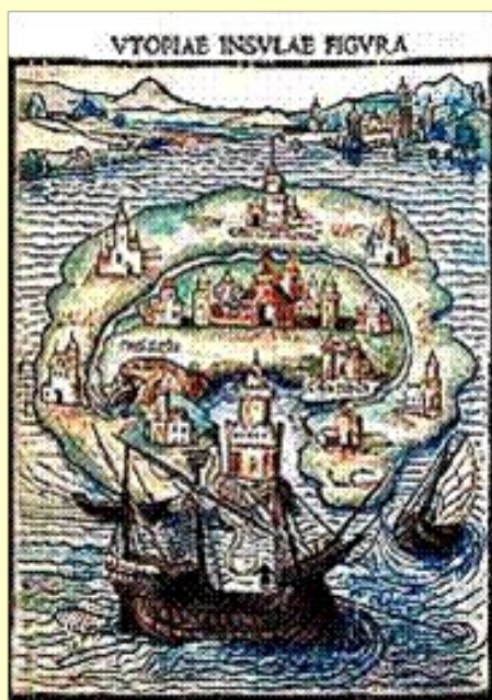
Обложка книги Томаса Мора «Утопия»

Томас Мор назвал свой труд «Золотая книжечка, столь же полезная, сколь и забавная о наилучшем устройстве государства и о новом острове Утопия».