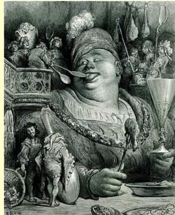
Иллюстрация к книге «Гаргантюа и Пантагрюэль»

Но больше всего нападает Рабле на монахов. Монахами он населил остров Звонкий, и единственное, чем они там занимаются, — это бьют поклоны да звонят в колокола. "Монах не пашет землю в отличие от крестьянина, не охраняет отечество в отличие от воина, не лечит больных в отличие от врача... монахи только терзают слух окрестных жителей дилим-бомканьем своих колоколов" .