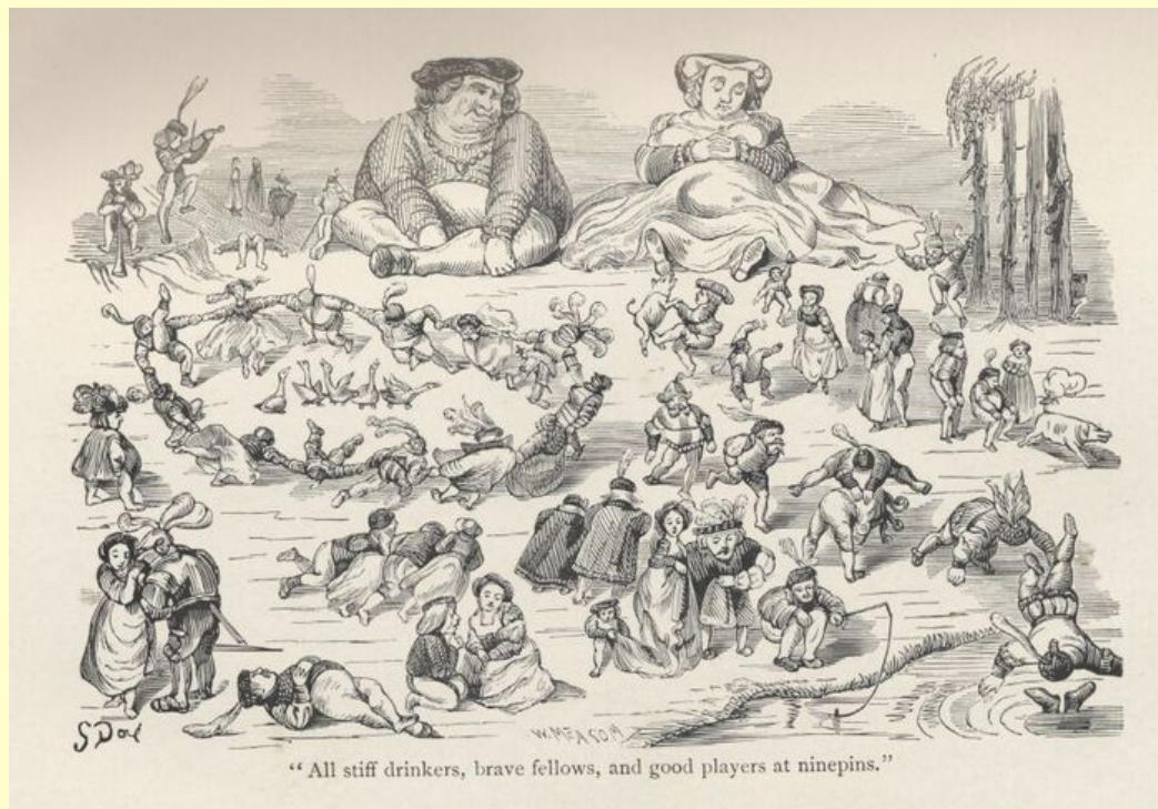
Иллюстрация к книге «Гаргантюа и Пантагрюэль»

Орудие сатиры Рабле - смех, смех исполинский, часто чудовищный, как его герои. Не удивительно, что книга Рабле вызывала такую ярость - здесь досталось всем. О королях писатель говорит устами Панурга: "Эти чертовы короли здесь у нас на земле, - сущие ослы: ничего-то они не знают, ни на что не годны, только и умеют, что причинять зло несчастным подданным..."