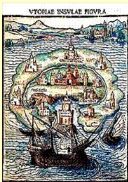
Обложка книги Томаса Мора «Утопия»

Томас Мор назвал свой труд «Золотая книжечка, столь же полезная, сколь и забавная о наилучшем устройстве государства и о новом острове Утопия».