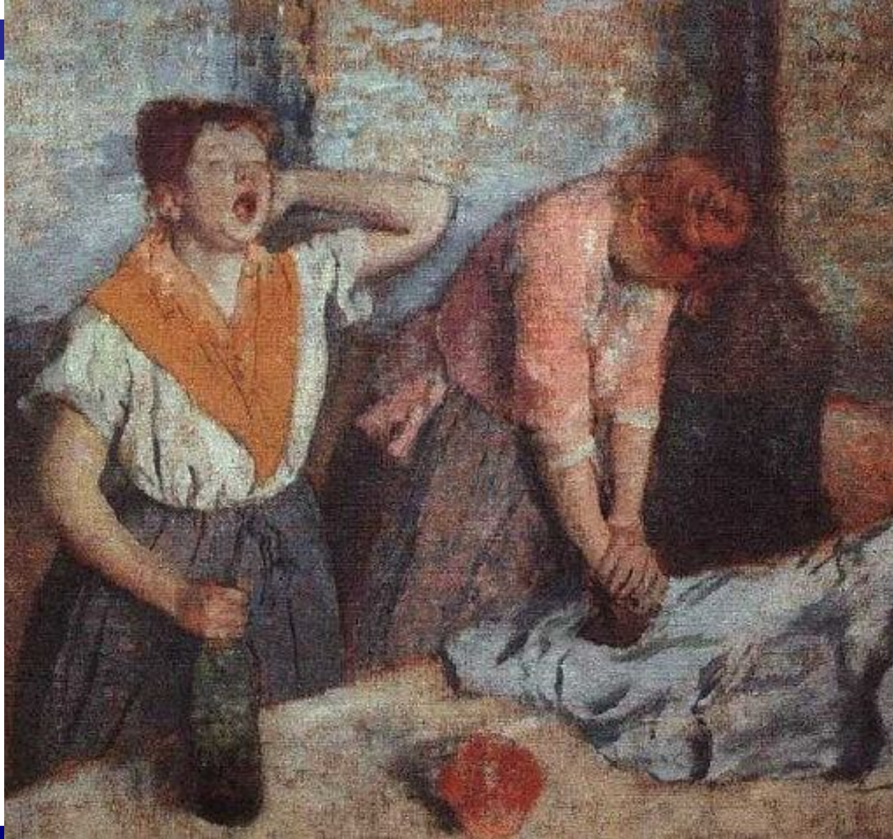
Гладильщицы. Эдгар Дега (1884)