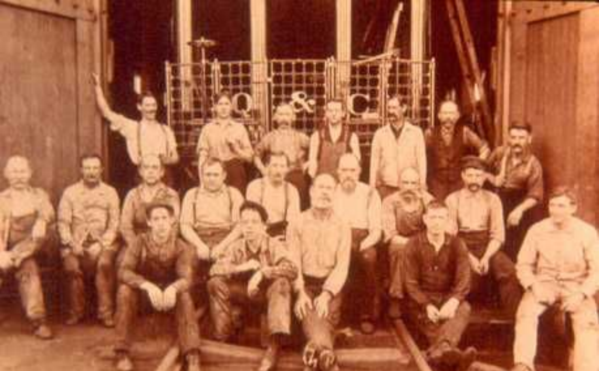
Американские железнодорожные рабочие (1910 г)