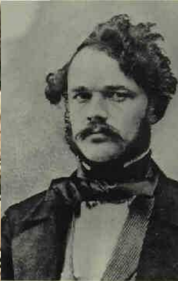
Werner von Siemens, 1845

Э. фон Сименс с семьей. Сименс – предприниматель, получивший дворянство