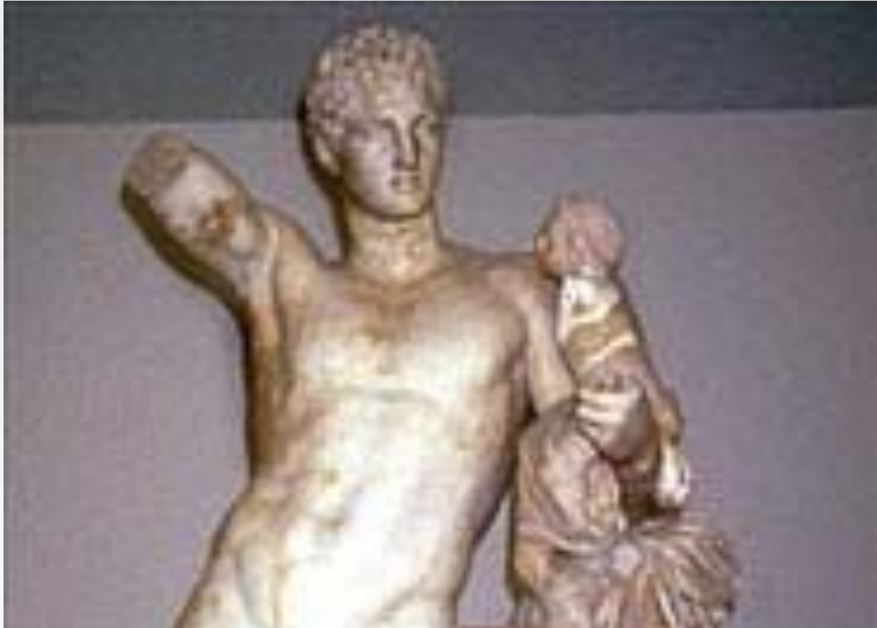
Пракситель. Гермес с младенцем Дионисом. Середина 4 в. до н.э.