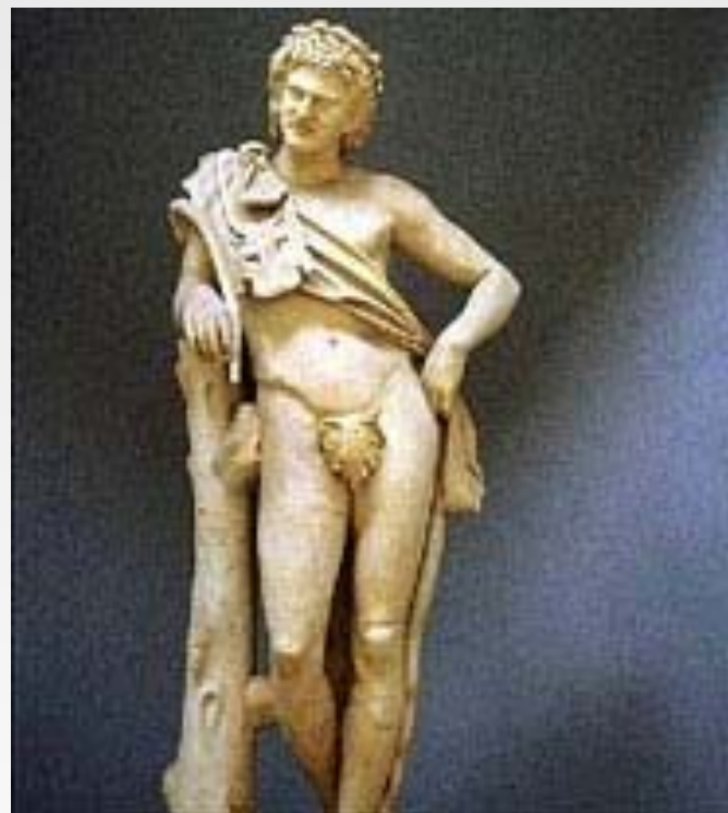
Пракситель. Отдыхающий Сатир. Около 340-330 гг. до н.э. Капитолийские музеи, Рим.