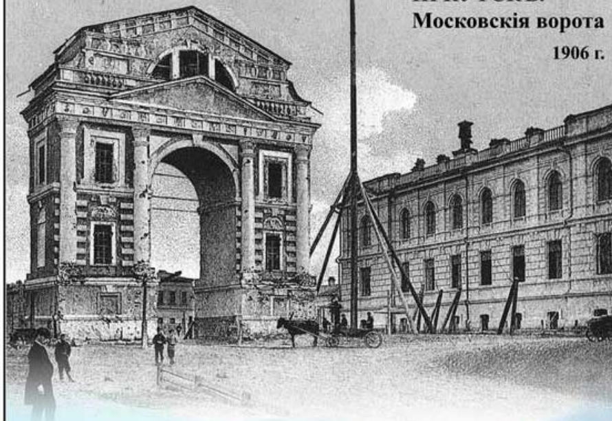
ИРКУТСКЪ. Московскія ворота 1906 г.