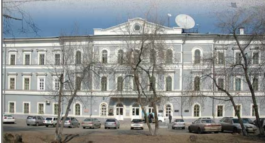
Факультет госуниверситета 2008 г.

В институте обучали французскому и немецкому языкам, арифметике, рисованию, истории, танцам, музыке, рукоделию, домоводству, предметам «светского обхождения»