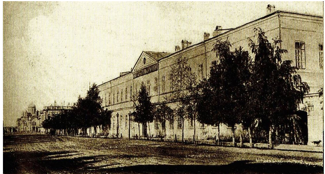
Иркутская мужская гимназия

Иркутская мужская гимназия была открыта 12 ноября 1805 г. Это была первая гимназия в Сибири