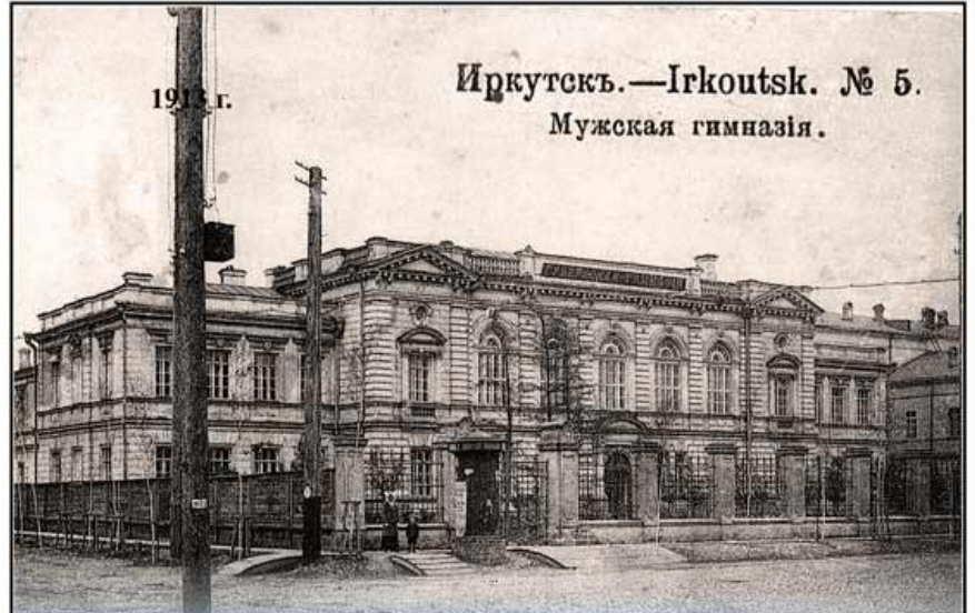
Иркутскъ.—Irkoutsk. № 5. Мужская гимназія.