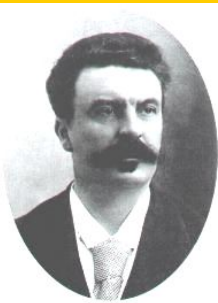
Ги де Мопассан.

В к.19 в. появился натурализм-течение отображавшее жизнь без прикрас. Авторы работавшие в данном ключе подвергались жесточайшей критике. Особенно доставалось Э.Золя и Г.де Мопассану. Но в их произведениях натурализм был лишь фоном для вскрытия острейших социальных проблем.