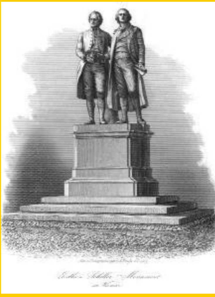
Гете и Шиллер. Гравюра н.19 в.

Байрон отправился в Грецию, чтобы принять участие в начавшейся там революции, но заболел и умер.