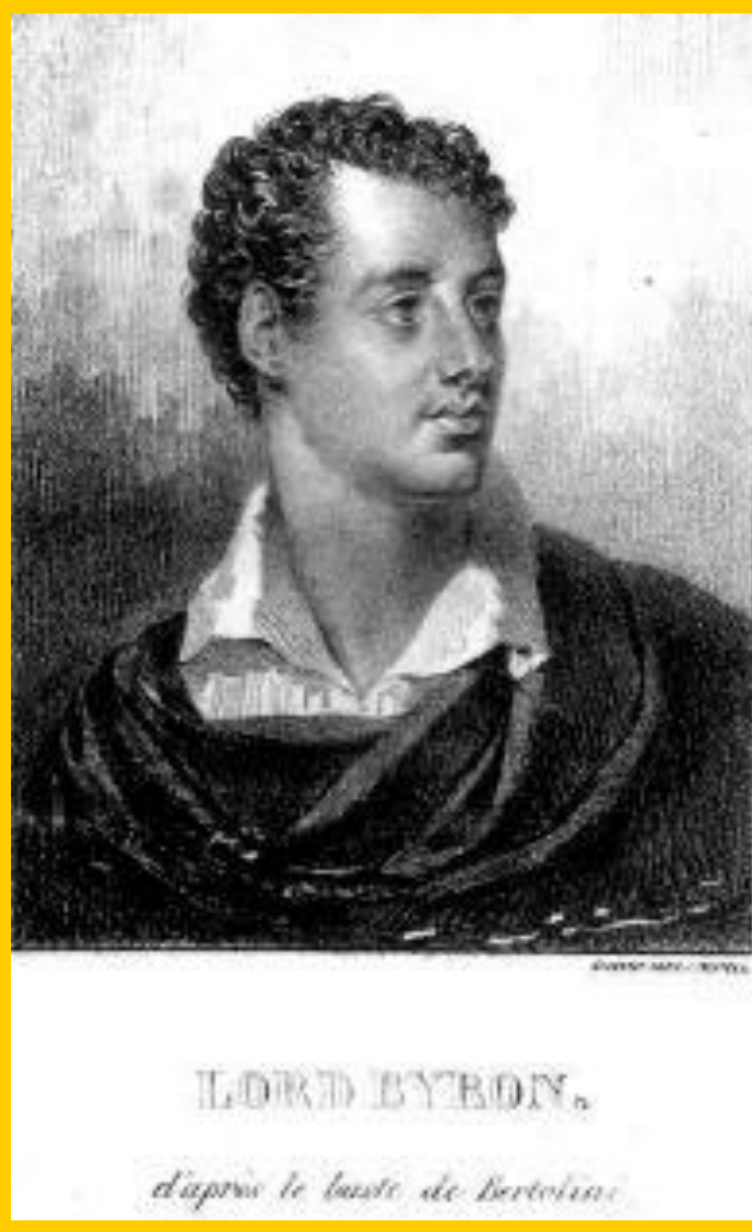
Джордж Байрон. Гравюра н.19 в.

Писатели 19 в. стремились глубоко исследовать действительность. На смену классицизму постепенно пришел романтизм. Это направление было обращено к прошлому, или к отвлеченным мечтаниям о добре и зле.