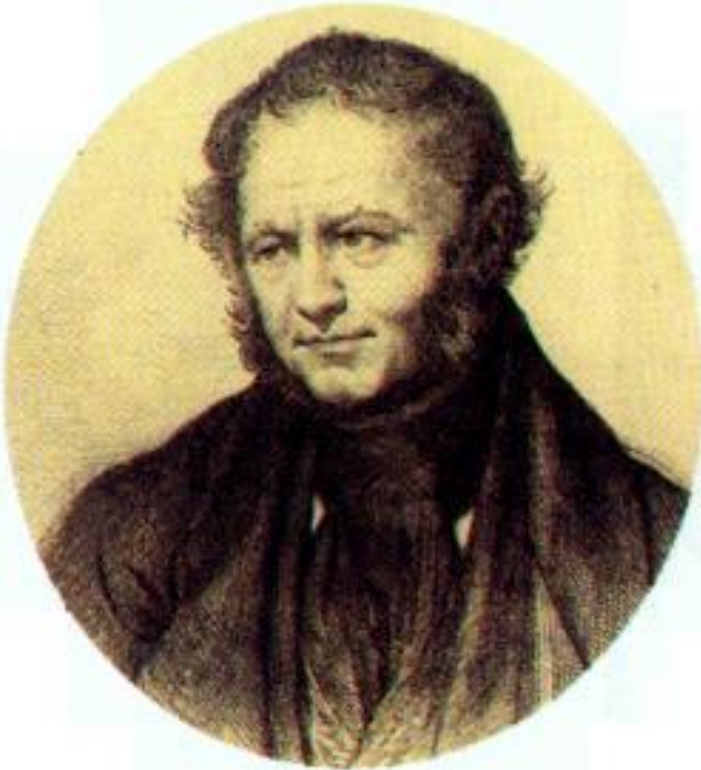
Стендаль. Гравюра н.19 в.

О. де Бальзак в цикле «Человеческая комедия» (ок. 100 произведений), нарисовал многогранную картину французского общества.