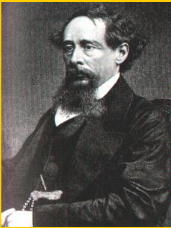
Ч.Диккенс. Гравюра 19 в.

В 1830-х гг. возникает реализм. В творчестве Ч.Диккенса раскрывается духовная жизнь и социальная история Англии 19 века. Автор предлагает спокойно искоренять человеческие пороки и «лечить» общество вместо того, чтобы подрывать вековые устои.