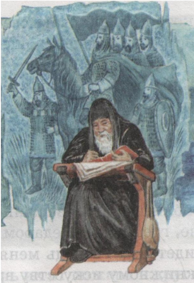
Нестор – летописец, автор «Повести временных лет»

Основными источниками сведений о жизни Святослава являются «История» Льва Дьякона и «Повесть временных лет» .