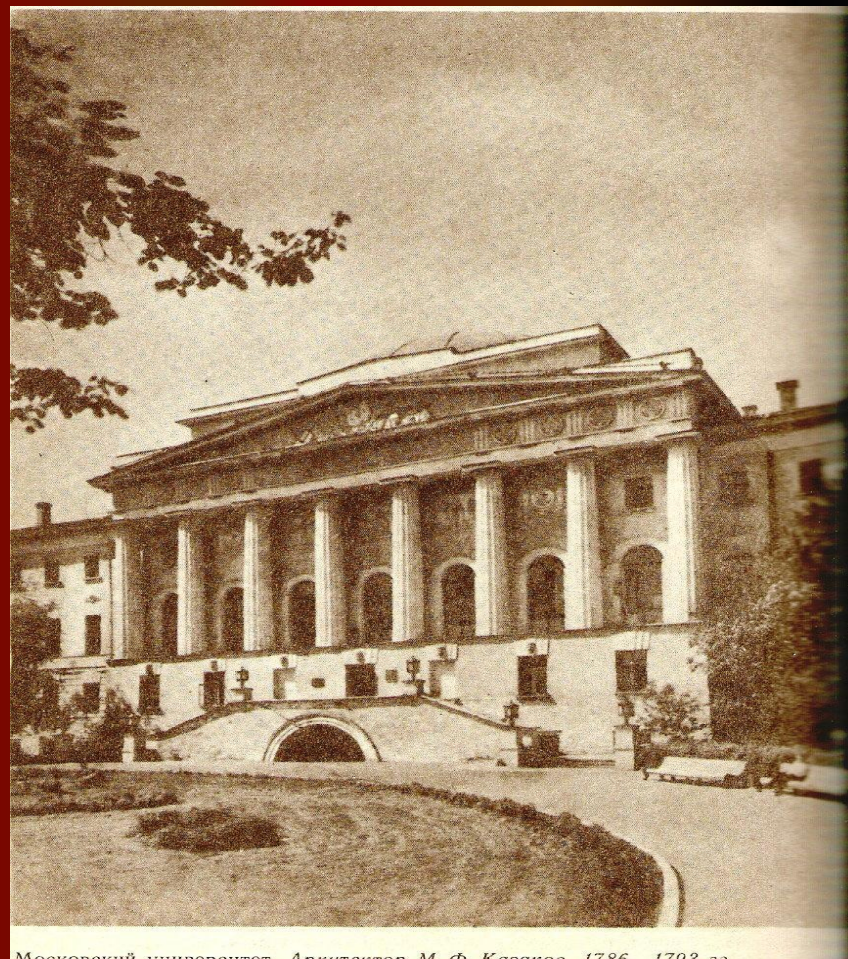
Московский университет. Архитектор М. Ф. Казаков. 1786 - 1793 гг.