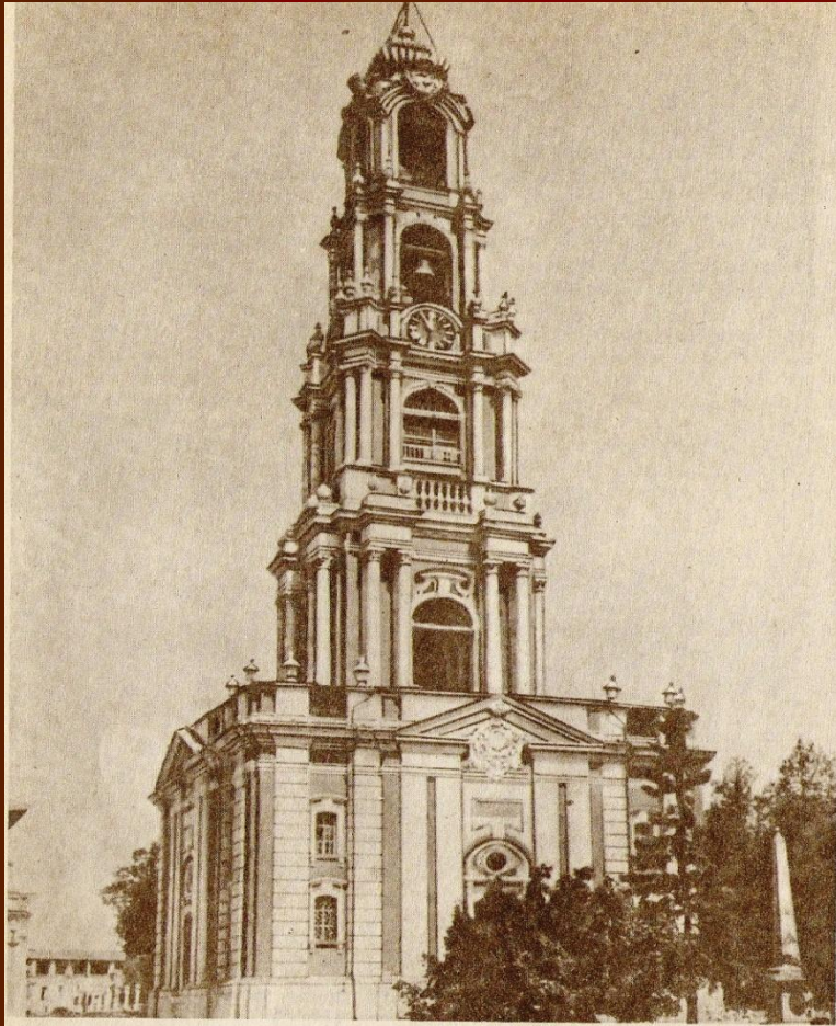
Колокольня Троице-Сергиевой лавры. Архитекторы И. Шумахер, И. Мичурин.