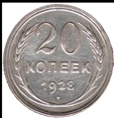
20 копеек 1928 г