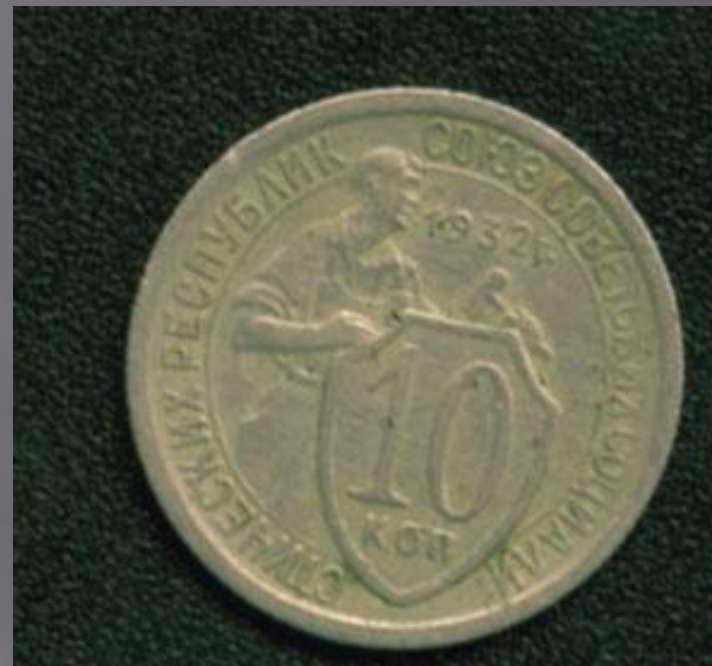
10 копеек 1932г