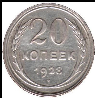
20 копеек 1928 г