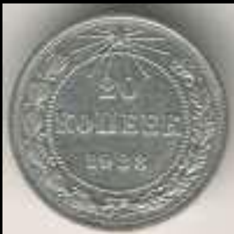
20 копеек 1923 г