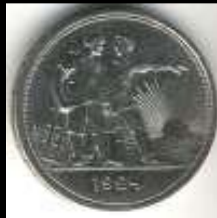
Рабочий и крестьянин