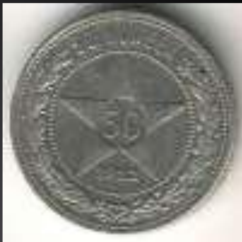
50 копеек 1922г.