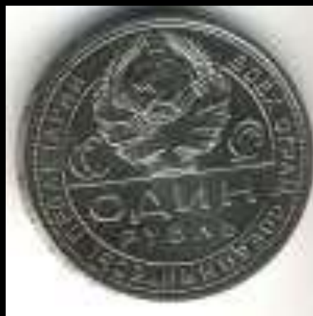
1 рубль 1924 г