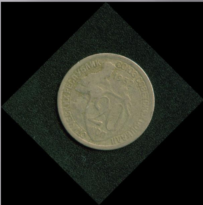
20 копеек 1932г