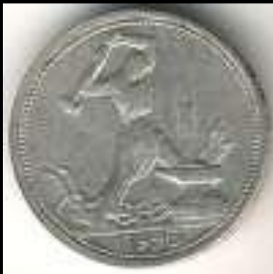
50 копеек 1925 г