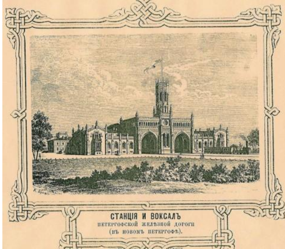
СТАНЦІЯ И ВОКСАЛЬ ПЕТЕРГОФСКОЙ ЖЕЛЪЗНОЙ ДОРОГИ (ВЪ НОВОМЪ ПЕТЕРГОФЪ).

Сколько лет Петродворцу? 299. Он впервые упоминается 12 июля 1705 года, когда Петр выстроил в нем "путевые хоромы" на полдороги в строящийся Кронштадт. Эта дата считается днем рождением города, связанная в нашем представлении с предпосылкой к зарождению всемирно известного комплекса столицы