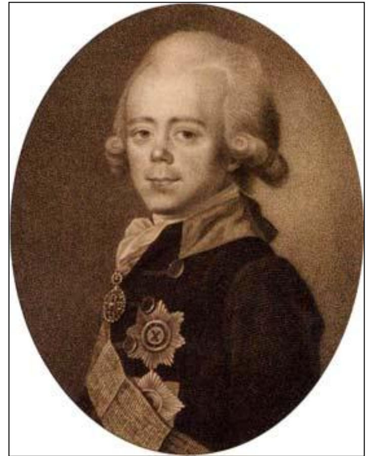
Император Павел I. Гравюра. 1818 года.