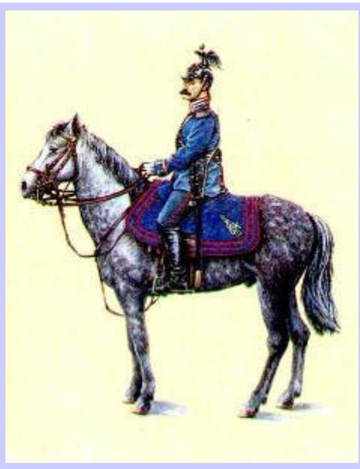
Жандарм в парадной форме

Главной задачей консерваторов стала попытка оградить императора от влияния либералов и стремление ограничить реформы.