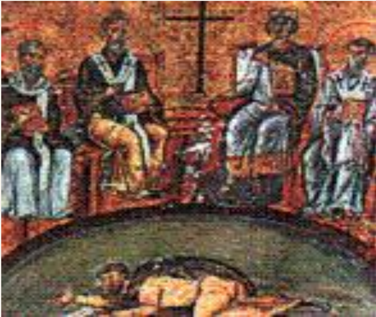
Никейский собор осуждает учение Ария — изображение IV века