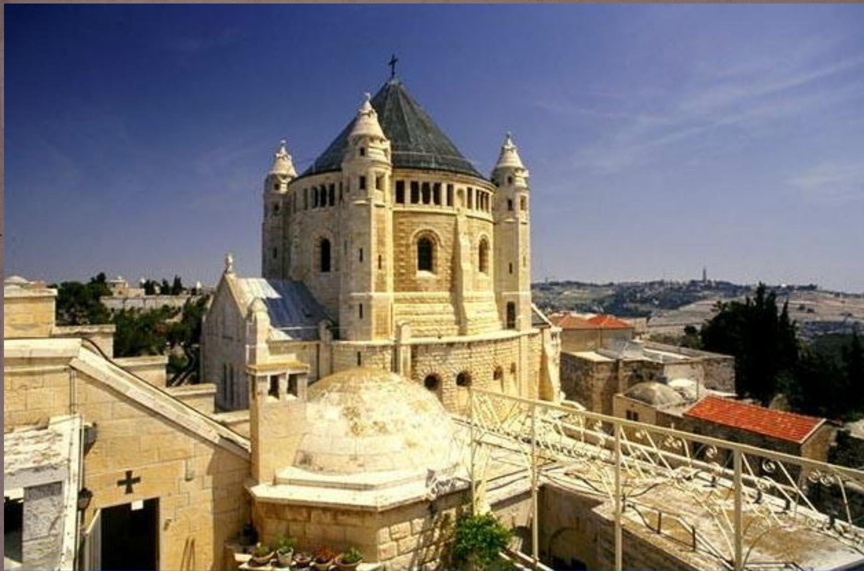
Старый Иерусалим. Успенский монастырь.