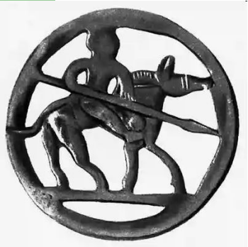
Германцы. Алеманнская прорезная бляха. Бронза. 6-7 вв.