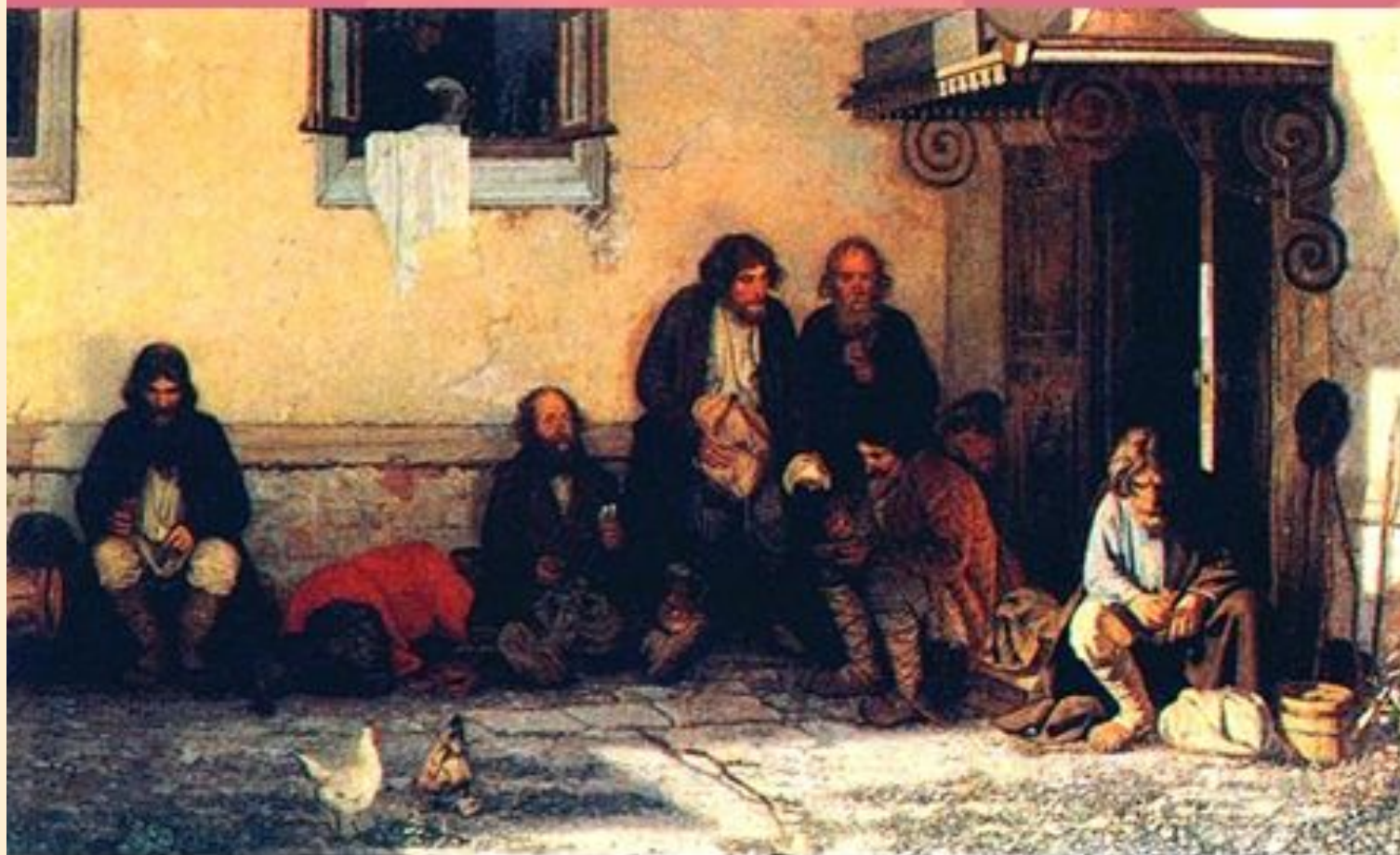
Г.Мясоедов. «Земство обедает»